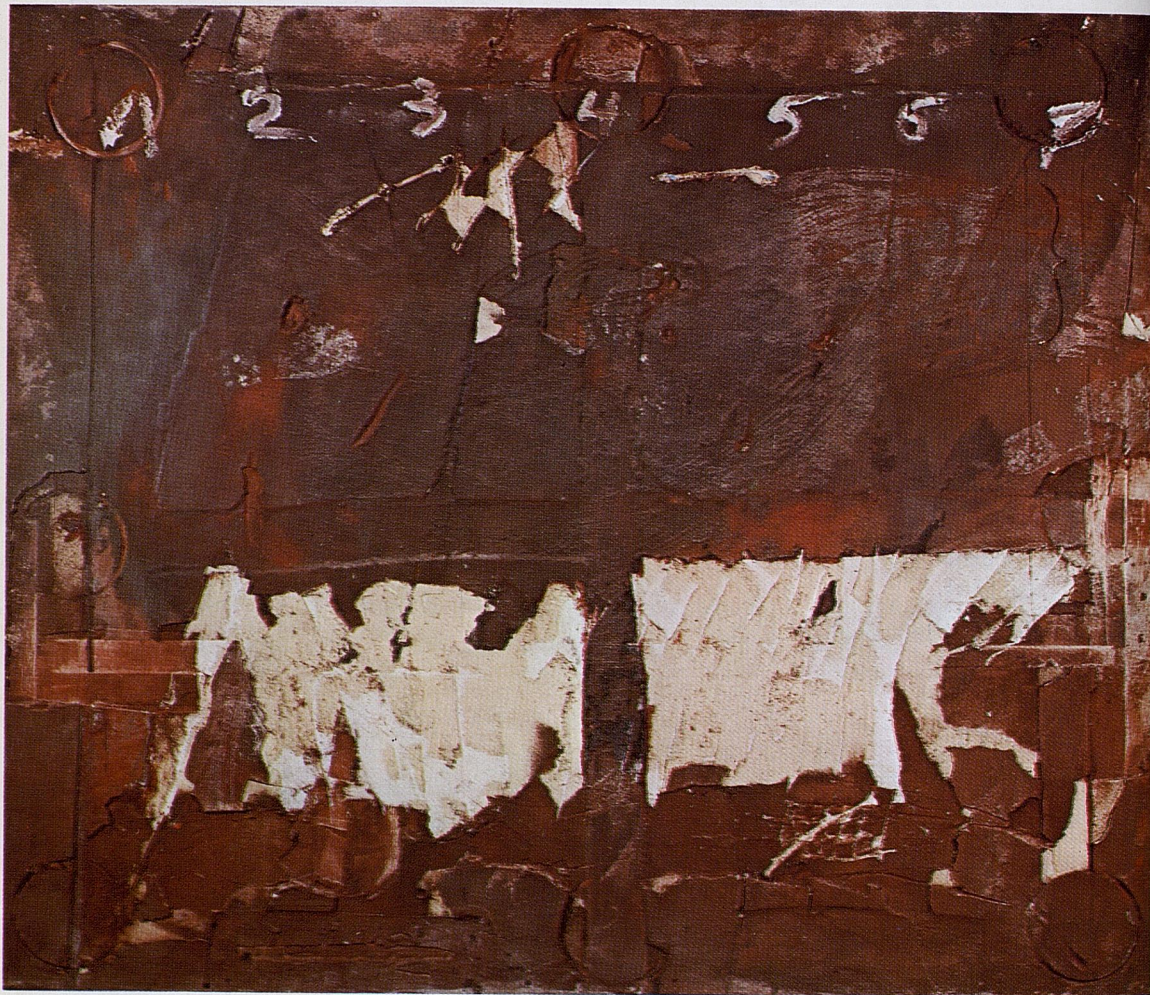
"Escrostonat i xifres", 1974