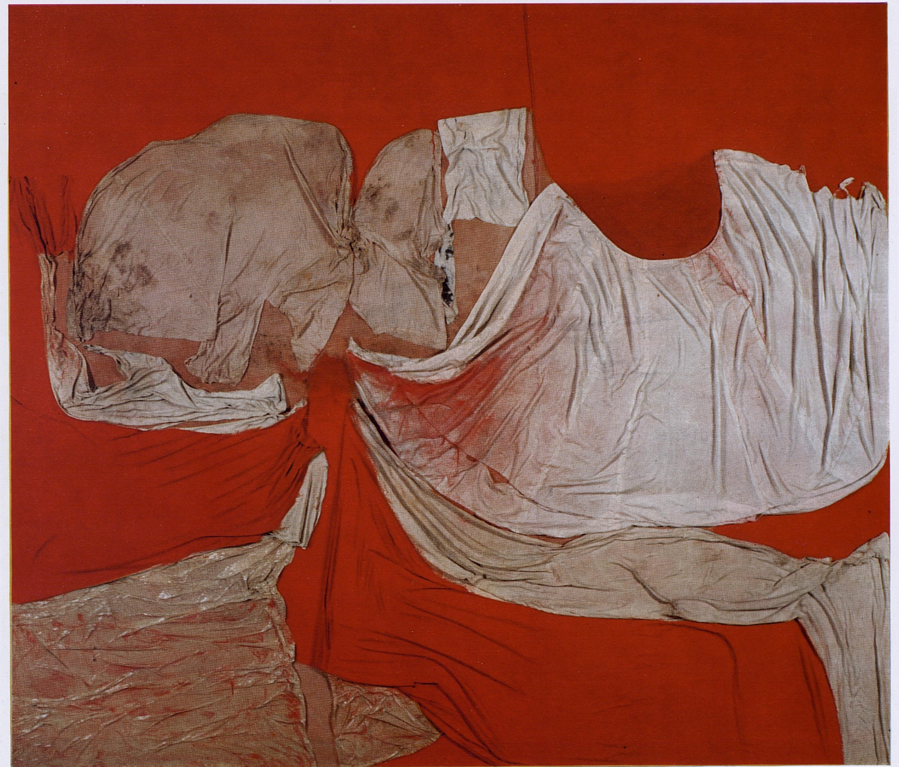
37 Rosso, 1956 - cm. 186 x 190 - Proprietà dell'artista.