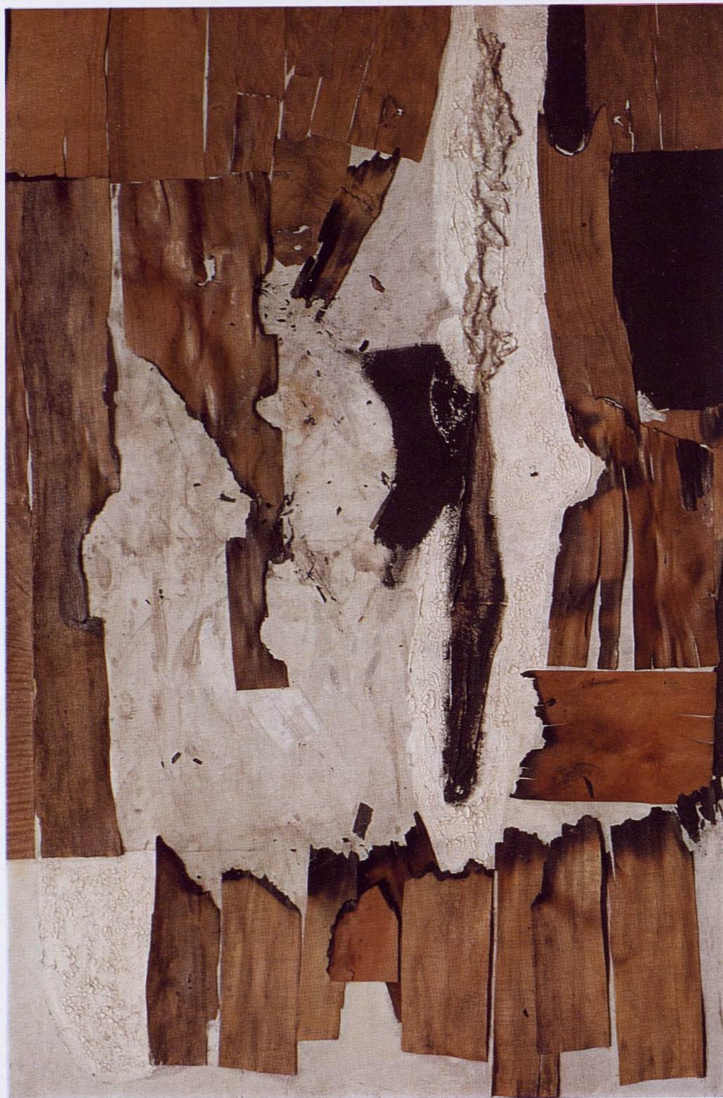
36 Combustione Legno, 1955 - cm. 158 x 86 - Proprietà dell'artista.