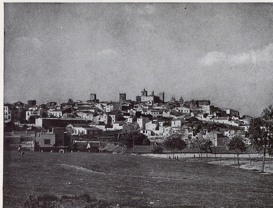
CÁCERES Y SU INCONFUNDIBLE PERFIL SEÑORIAL.

ES PROPIEDAD • RESERVADOS TODOS LOS DERECHOS