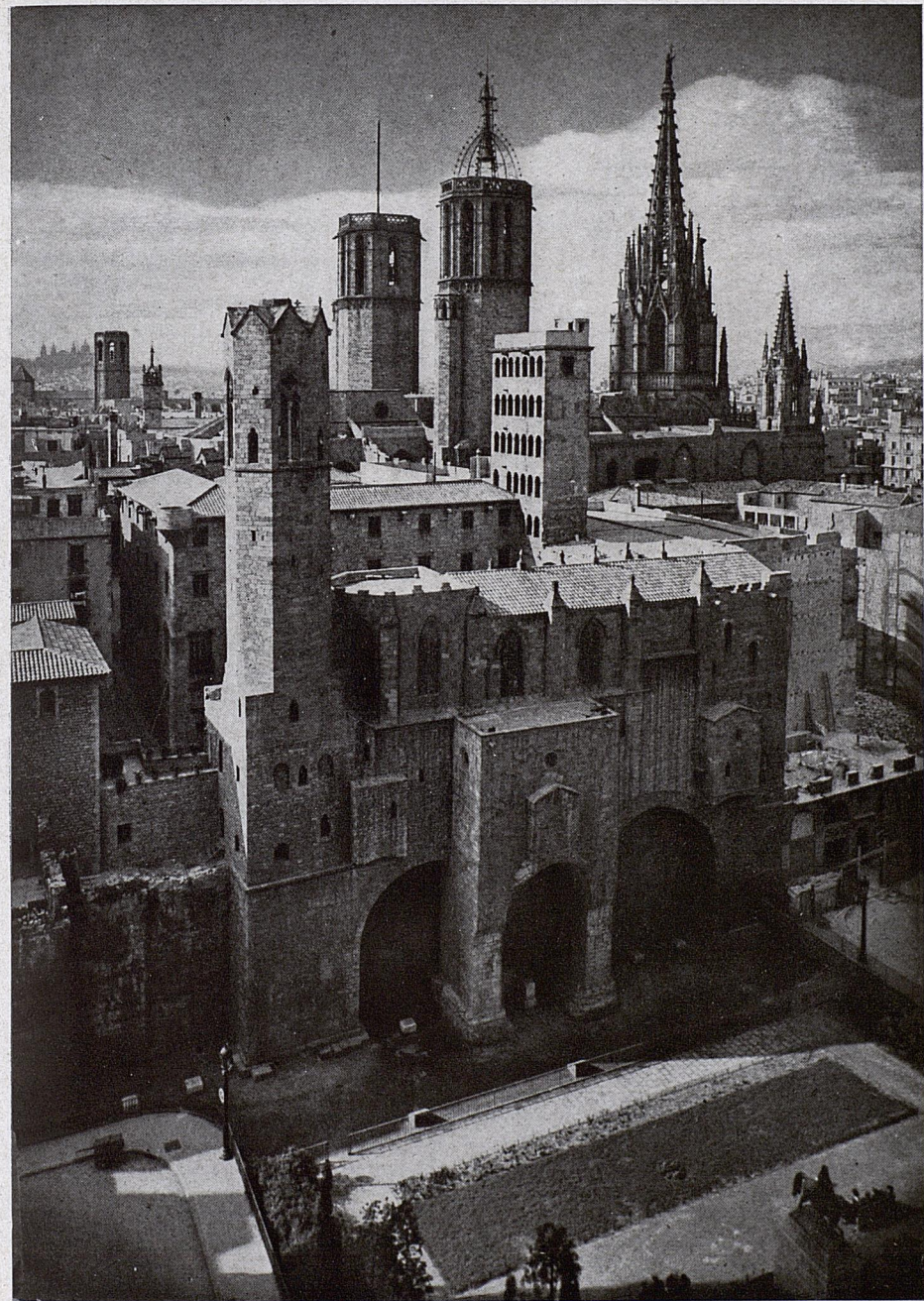
VISTA PANORÁMICA SOBRE EL BARRIO GÓTICO.

Los Museos Arqueológico y de Historia de la Ciudad atesoran fragmentos escultóricos y arquitectónicos y los mosaicos, lápidas y utensilios, descubiertos al correr de los siglos modernos, sobre los cuales, mucho más que sobre fuentes escritas, se basa la imagen histórica y monumental que tenemos trazada de la ciudad en los tres primeros siglos de nuestra era.