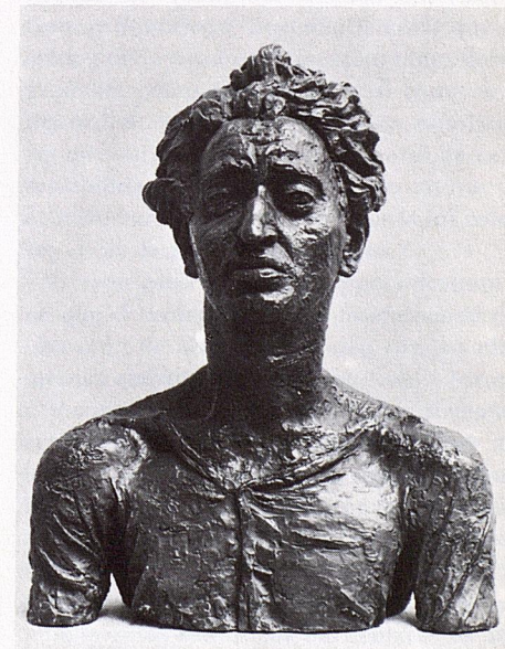
180. Jacob Epstein: Busto de Kramer, 1921. Bronce. Londres, Galería Tate.

La guerra puso término a la corta actividad de Epstein como vorticista —no exhibió con los otros en 1915— y al tipo de utilización extrema y original de materiales ejemplificado en Taladro . Sólo meses más tarde, en su busto en bronce de Lord Fisher (Museo Imperial de la Guerra) dio con la fórmula familiar ahora para la expresión del pathos , que, a partir de entonces, separa sus tan admirados retratos de los que había hecho una década antes en estilo moderadamente renacentista o rodinesco. Dio fuerza a la proyección de las facciones, trabajó los ojos y la boca como huecos oscuros y dejó la superficie del barro con la