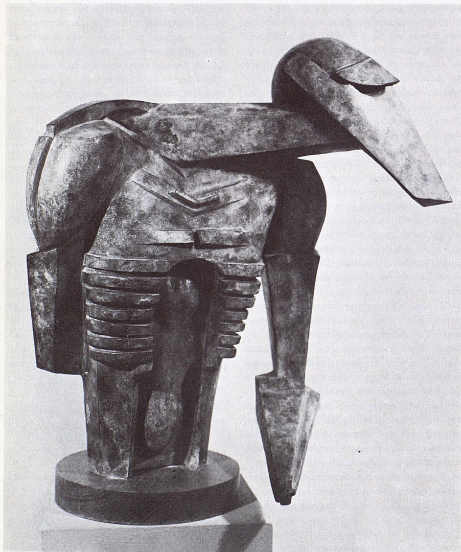
179. Jacob Epstein: Taladro, 1912-13. Bronce. Nueva York, Museo de Arte Moderno.

menburg, Italia) que, originalmente, debía de tener un significado fálico. Las Venus de Epstein reposan sobre palomas apareadas, tema tratado por el escultor en, por lo menos, tres grupos distintos de pájaros. Esas esculturas, junto con figuras más pequeñas en flenita y yeso, y con Madre y Niño , de mármol, en Nueva York, y Taladro [179], forman las obras que pusieron a Epstein en relación con el Grupo de Londres y el Vorticismo, aunque en realidad nunca fue miembro del Centro de Arte Rebelde de Lewis.