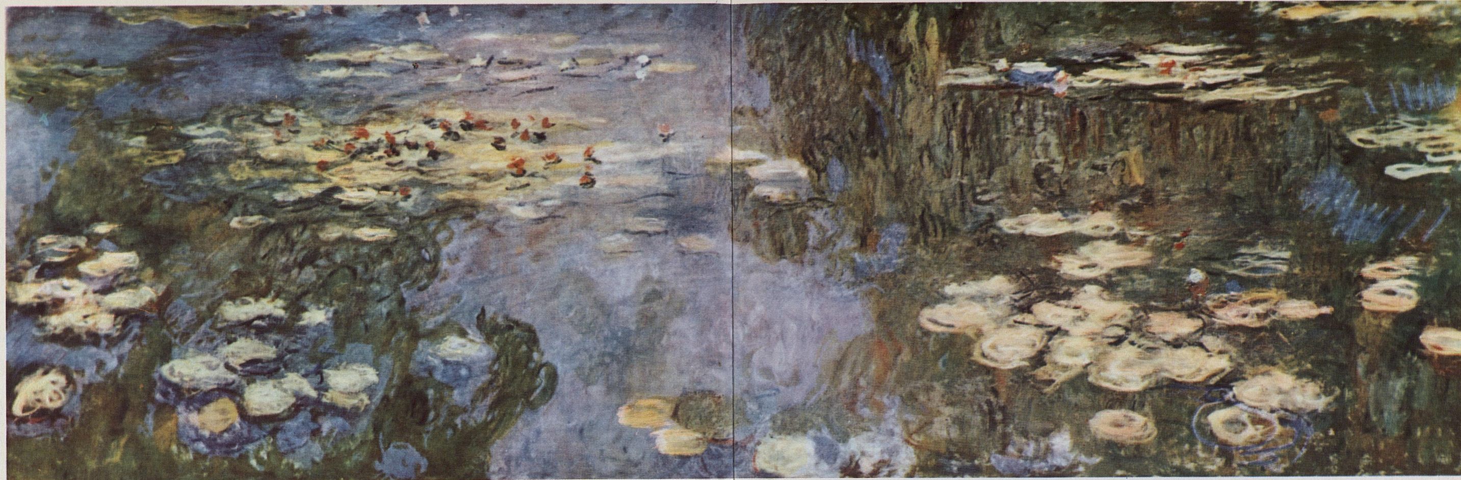
NENÚFARES. Lienzo 200 × 600 cm.

Colección Walter P. Chrysler Jr., Nueva York