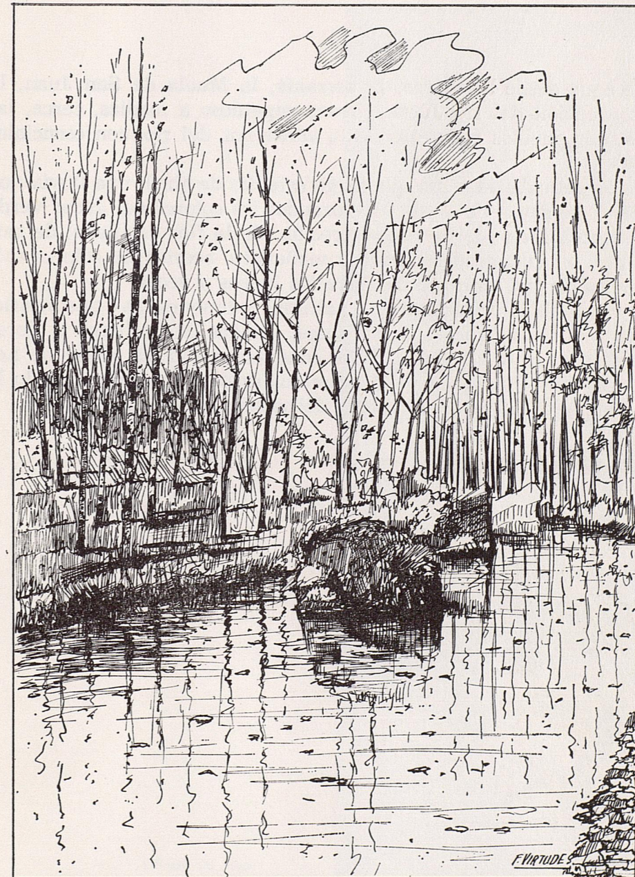
Dibujo de Federico Virtudes