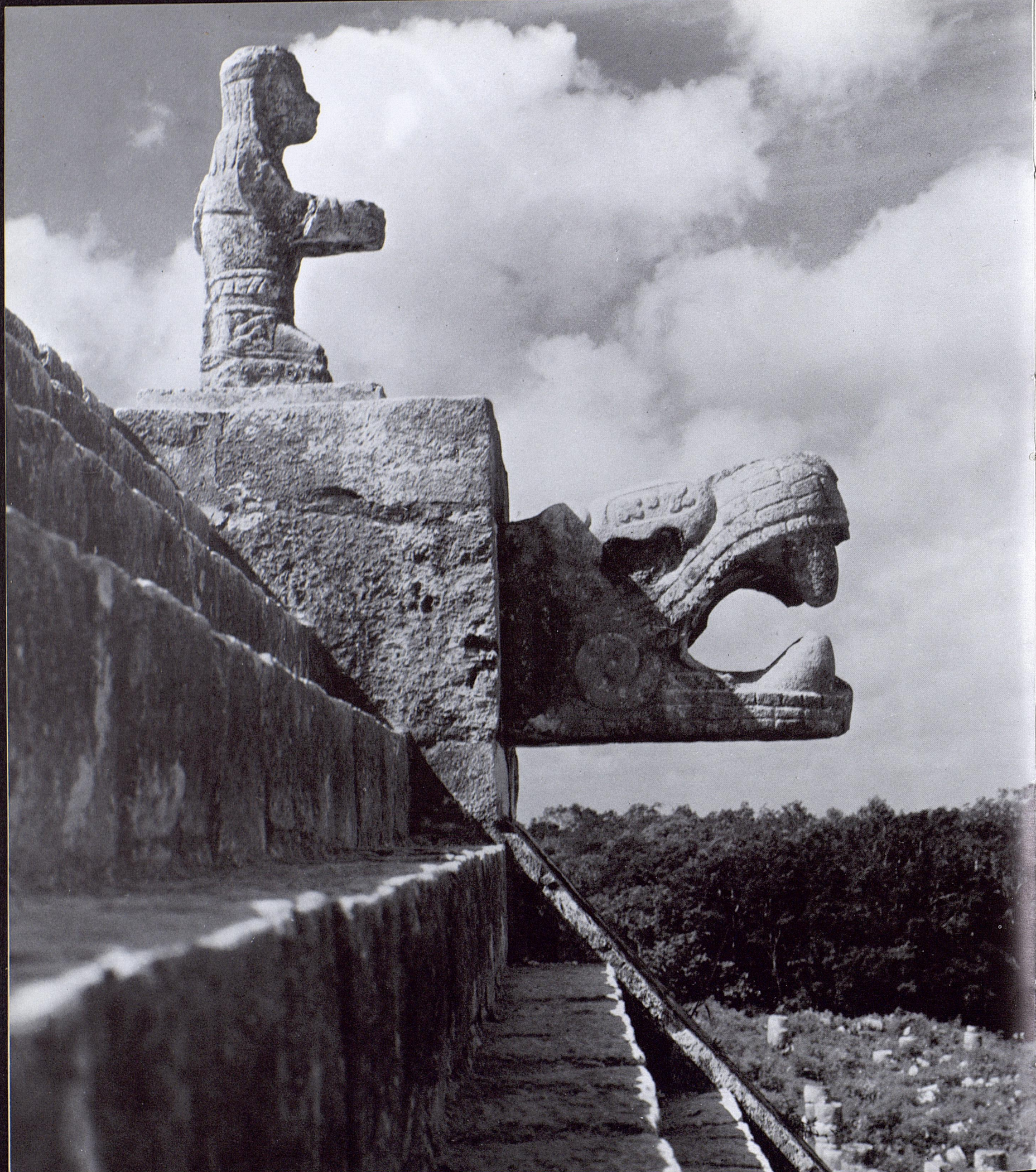
◁ 335. Chichén Itzá, detalle de las esculturas de la escalinata del templo de los Guerreros.