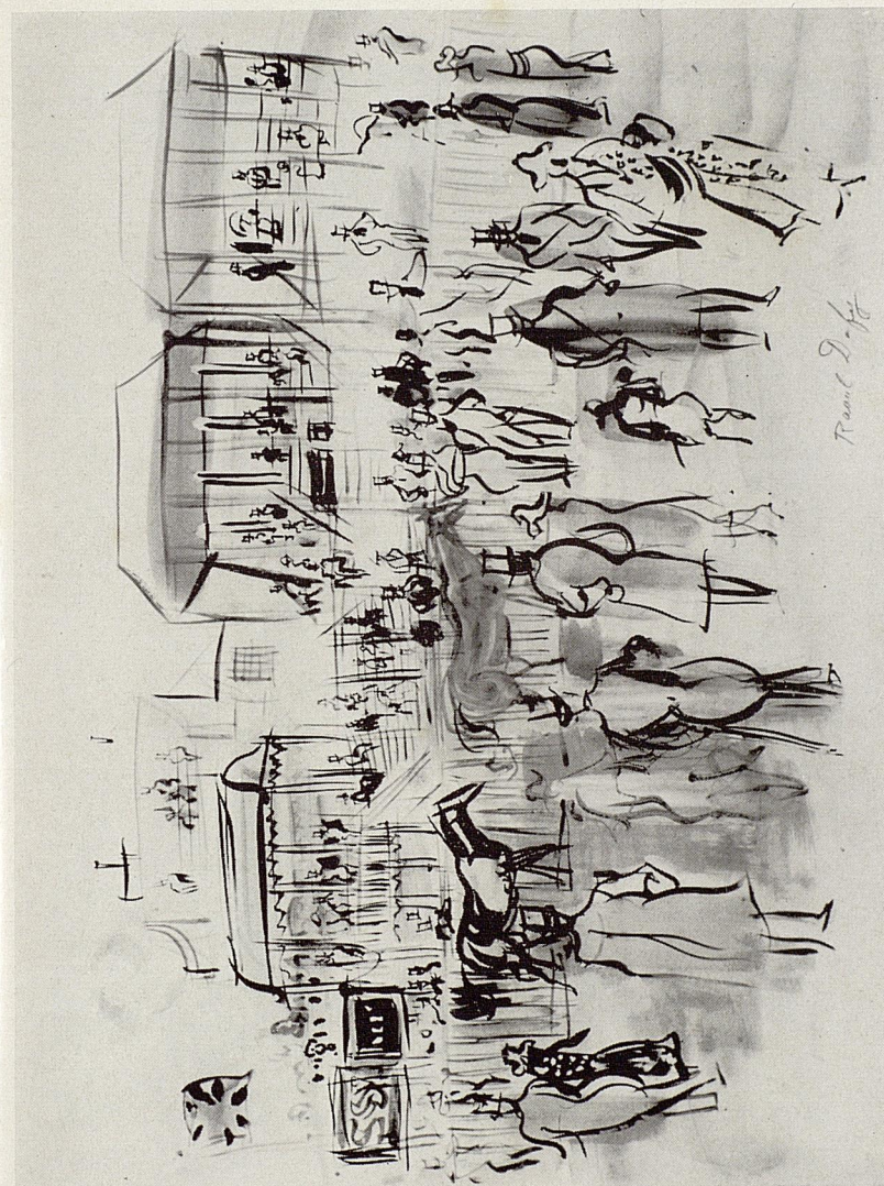
DUFY - Les Courses (Collection Pétrides)

Jamais Derain, qui comme tous les peintres de sa génération a connu les mêmes engouements, n'a perdu de vue l'objet qu'il s'était proposé d'atteindre. S'il a successivement pratiqué le fauvisme, l'art nègre, le cubisme, c'était plutôt afin d'en acquérir l'expérience que d'en devenir l'esclave. Ses meilleurs tableaux offrent toujours entre eux un puissant équilibre qui, de quelque théorie qu'ils s'inspirent, lui est propre et dégage sa robuste personnalité. Qui se souciera dans cent ans que Van Gogh ait déterminé la réaction des Fauves et Cézanne celle de Picasso? Il suffira qu'ils aient été de grands artistes. L'œuvre vaut plus que la formule. Or, dès qu'on examine précisément l'œuvre de Derain, on est frappé, non point de