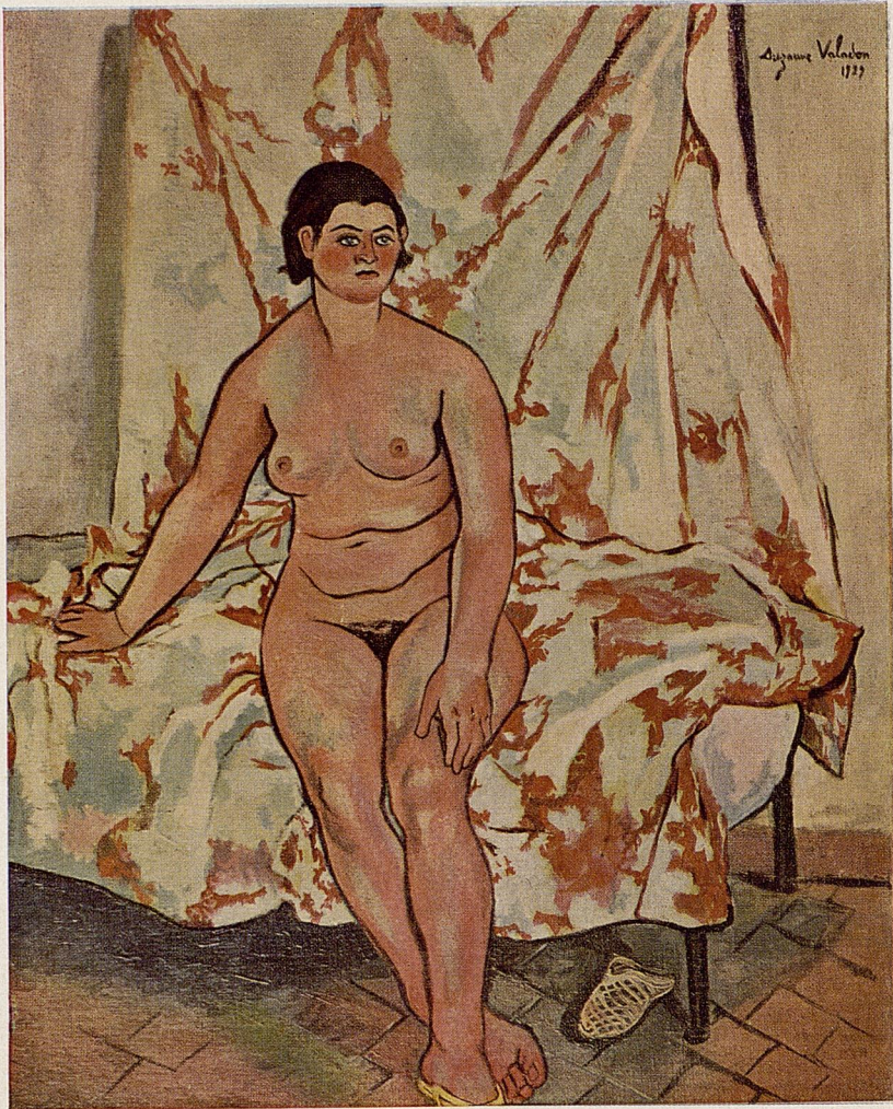
Suzanne VALADON - Femme nue (Collection Carco)