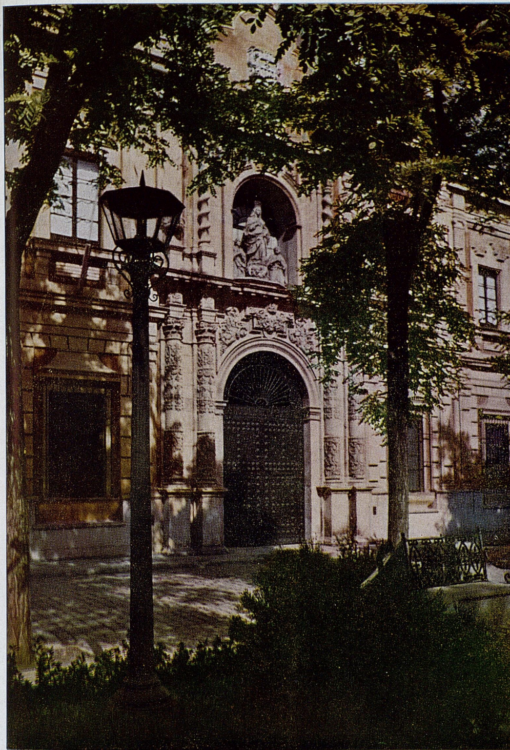
Museo de Bellas Artes de Sevilla. Fachada

BIBLIOGRAFÍA. — Museo Arqueológico Provincial de Sevilla. Guía sumarisima para visitarlo , Madrid, 1945. — FERNÁNDEZ CHICARRO Y DE DIOS, CONCEPCIÓN: El Museo Arqueológico Provincial de Sevilla , Madrid, 1951 (con abundante bibliografía suplementaria en las págs. 97-103). — GARCÍA Y BELLIDO, ANTONIO: Museo Arqueológico de Sevilla. Catálogo de retratos romanos , Madrid, 1951. — Memorias de los Museos Arqueológicos , I, pág. 79; II, pág. 125; III, pág. 160 (COLLANTES DE TERÁN, FERNANDO: La colección Arqueológica Municipal de Sevilla , pág. 181); IV, página 122; V, pág. 126 (CABRÉ