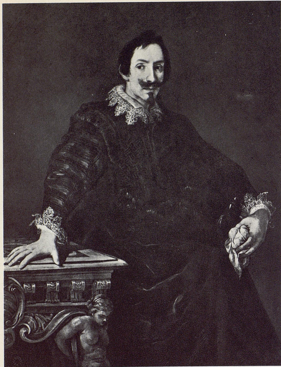
PIETRO DA CORTONA (1596-1669): Portrait de Marcello Sacchetti — Portrait of Marcello Sacchetti .

Pietro da Cortona fut sensible dans ce tableau à l'influence du Bernin: la vie intérieure du personnage se reflète sur le visage aux cheveux effilés, aux moustaches en désordre, dans les plis capricieux des dentelles.