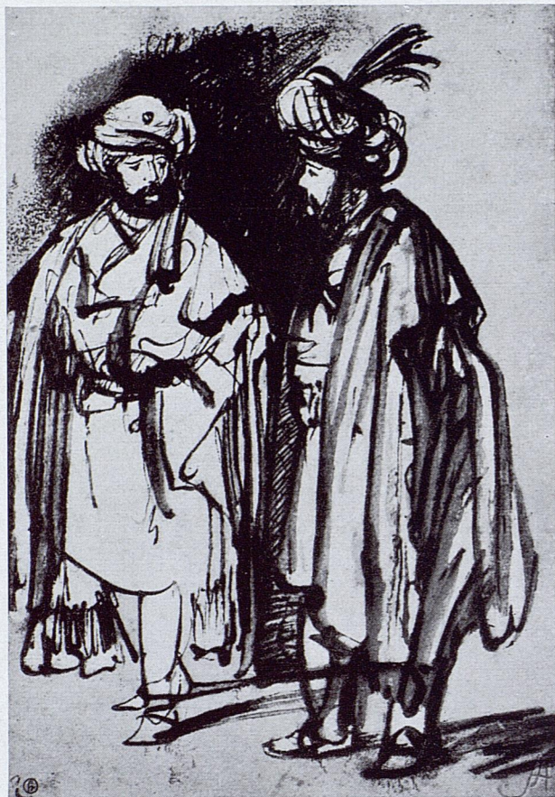
154. Rembrandt, Zwei Orientalen , Ben 212

Figurenstudien, von Elsheimer so reichlich im engen Zusammenhang mit Goudt gefertigt, die ihn fesselten und die er sich innerlichst anzueignen strebte. Er assimilierte sich die Struktur, auf die eingangs bei Elsheimer hingewiesen wurde (S. 23), die Senkrechte der Menschengestalt, fest aufstehend auf dem Boden, der aber nur durch Schlagschatten angegeben ist — ohne jede weitere Andeutung von Umwelt. Sowohl die Einzelperson als auch das aus Profil- und Frontalfigur bestehende Paar wurde ihm Vorbild. Im Katalog von Benesch ist es die Serie von Nr. 226—230, 234. Man erschrickt fast, wenn man von Elsheimer her kommt. Fast könnte dieser sie gemacht haben, selbst der saloppere Strich Goudts ist nicht ausgeschlossen. So pflegte Elsheimer die gegürtete Männerfigur im weiten, in Steilfalten herabfallenden Mantel mit festen breiten Strichen darzustellen, zuweilen schreitend, einen Fuß quer zurückgestellt (vgl. auch die Pariser Zeichnung mit den sieben Personen, links, Demonts 540, oben S. 135), so eine seiner Figuren die Hand mit scharfen, gekrümmten Fingern gebieterisch oder sonst eindrucksvoll vorstrecken zu lassen, Ben 210/229, so Frontal- und Rückenfigur rechts und links gegenüberzustellen, daß sie sich fast zu umkreisen scheinen, Sk 88 (Abb. 12), so ein Paar zusammenzustellen, daß die abgedunkelte, stark konturierte Seite eines Körpers in die helle Fläche des andern hineinschneidet