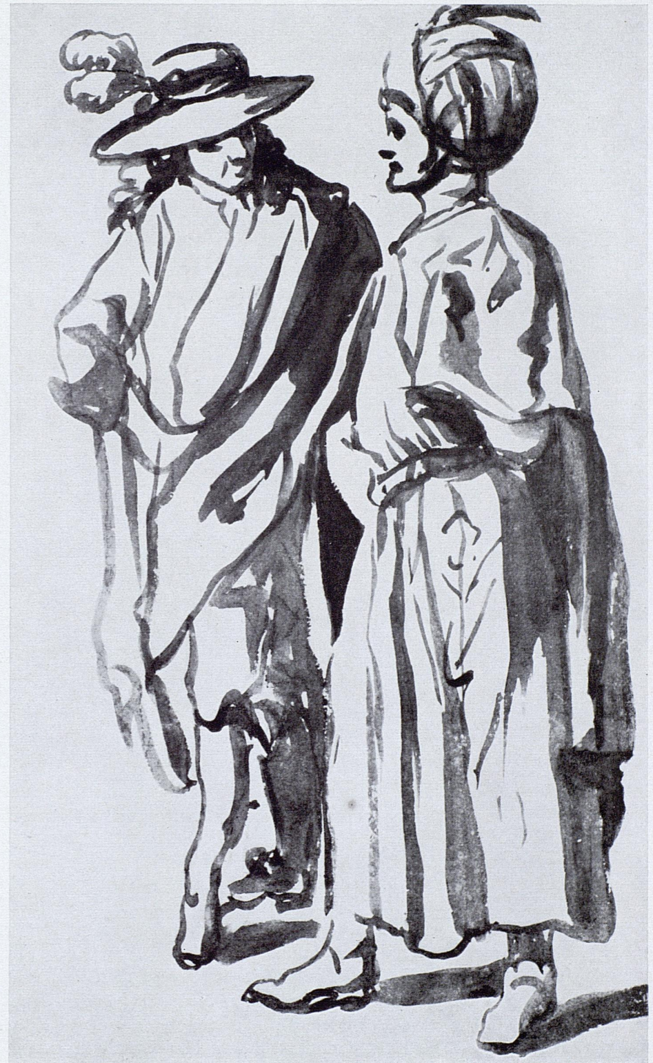
155. Elsheimer, Orientale und modisch gekleideter Mann , Budapest

Figurenstudien, von Elsheimer so reichlich im engen Zusammenhang mit Goudt gefertigt, die ihn fesselten und die er sich innerlichst anzueignen strebte. Er assimilierte sich die Struktur, auf die eingangs bei Elsheimer hingewiesen wurde (S. 23), die Senkrechte der Menschengestalt, fest aufstehend auf dem Boden, der aber nur durch Schlagschatten angegeben ist — ohne jede weitere Andeutung von Umwelt. Sowohl die Einzelperson als auch das aus Profil- und Frontalfigur bestehende Paar wurde ihm Vorbild. Im Katalog von Benesch ist es die Serie von Nr. 226—230, 234. Man erschrickt fast, wenn man von Elsheimer her kommt. Fast könnte dieser sie gemacht haben, selbst der saloppere Strich Goudts ist nicht ausgeschlossen. So pflegte Elsheimer die gegürtete Männerfigur im weiten, in Steilfalten herabfallenden Mantel mit festen breiten Strichen darzustellen, zuweilen schreitend, einen Fuß quer zurückgestellt (vgl. auch die Pariser Zeichnung mit den sieben Personen, links, Demonts 540, oben S. 135), so eine seiner Figuren die Hand mit scharfen, gekrümmten Fingern gebieterisch oder sonst eindrucksvoll vorstrecken zu lassen, Ben 210/229, so Frontal- und Rückenfigur rechts und links gegenüberzustellen, daß sie sich fast zu umkreisen scheinen, Sk 88 (Abb. 12), so ein Paar zusammenzustellen, daß die abgedunkelte, stark konturierte Seite eines Körpers in die helle Fläche des andern hineinschneidet