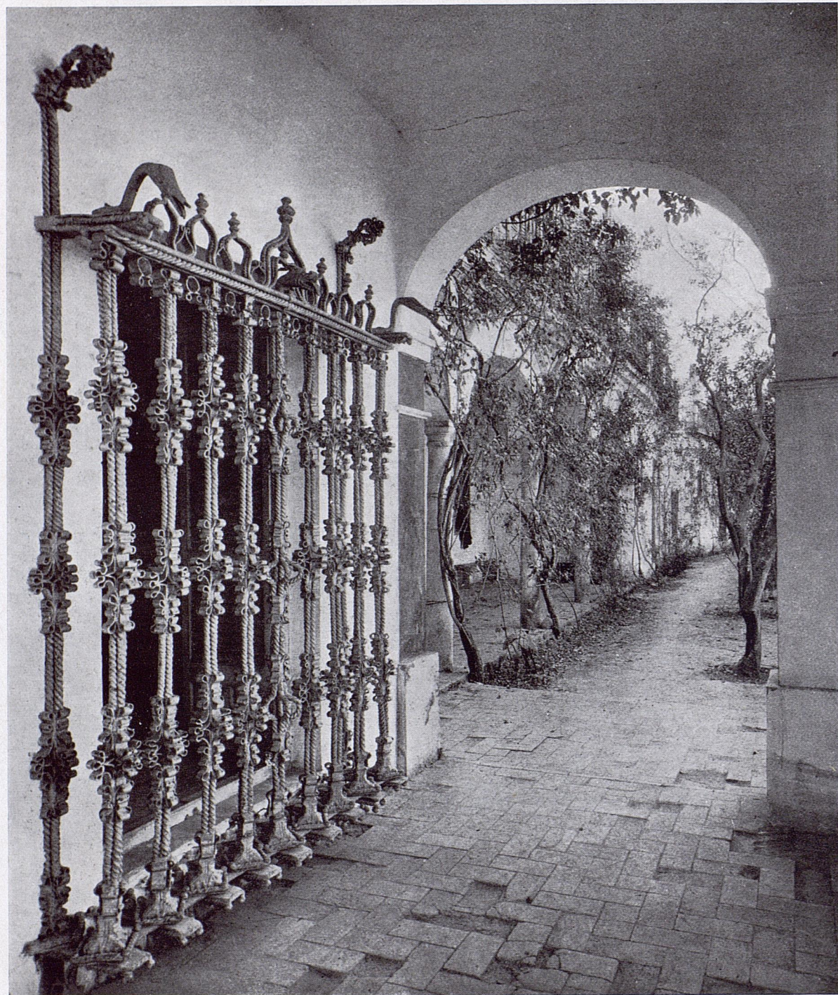
277. Reja del palacio de los duques de Medinasidonia, en Sanlúcar de Barrameda (Cádiz)