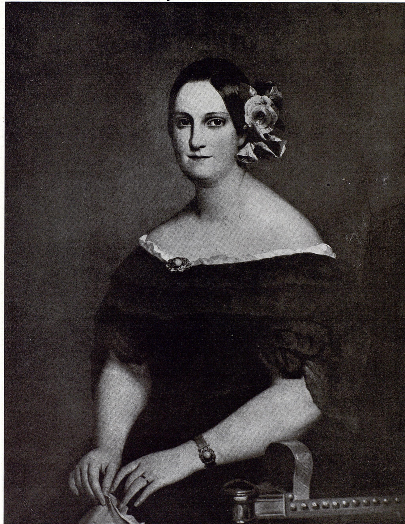
172. — DOÑA MARÍA CRISTINA DE BORBÓN-NÁPOLES Por F. X. WINTERHALTER