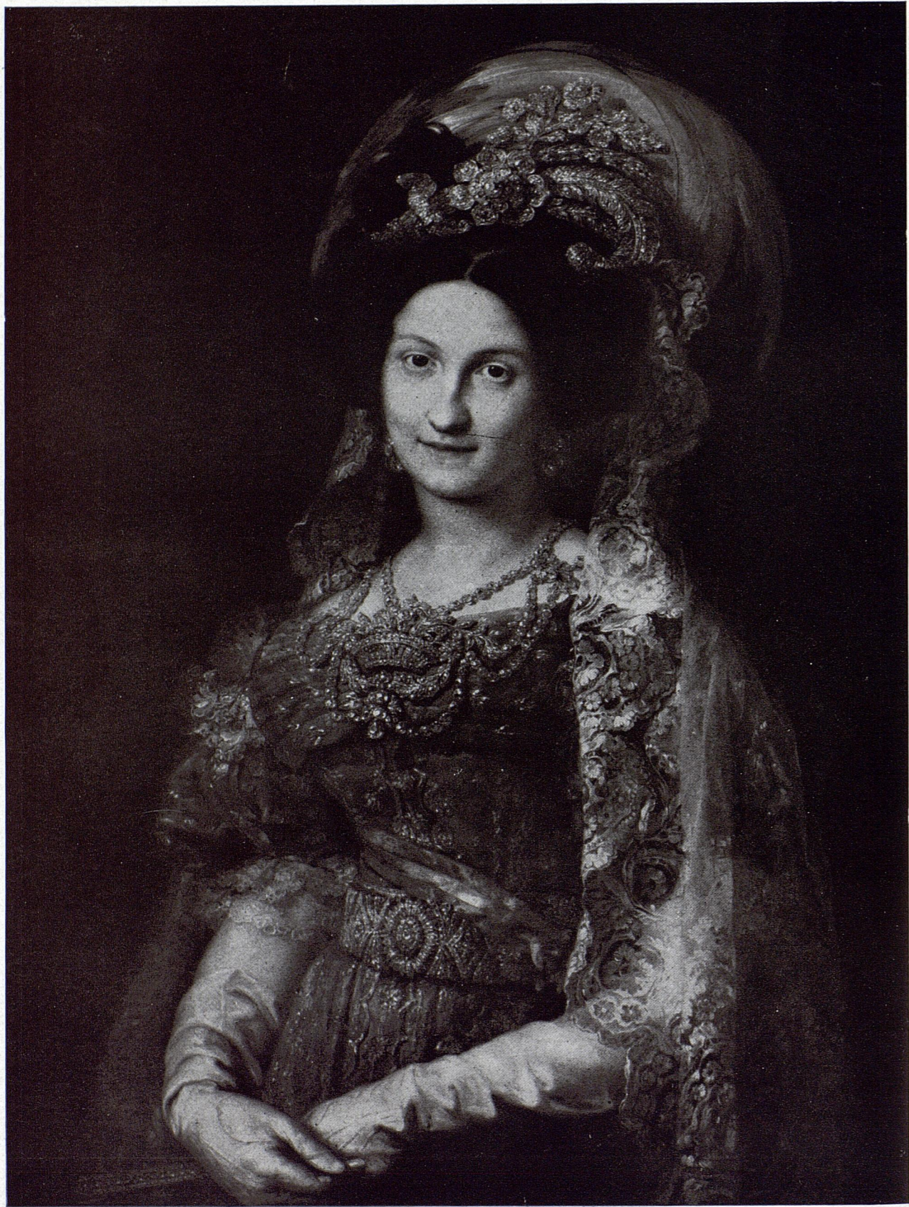
171. — DOÑA MARÍA CRISTINA DE BORBÓN-NÁPOLES, CUARTA ESPOSA DE FERNANDO VII Por VICENTE LÓPEZ