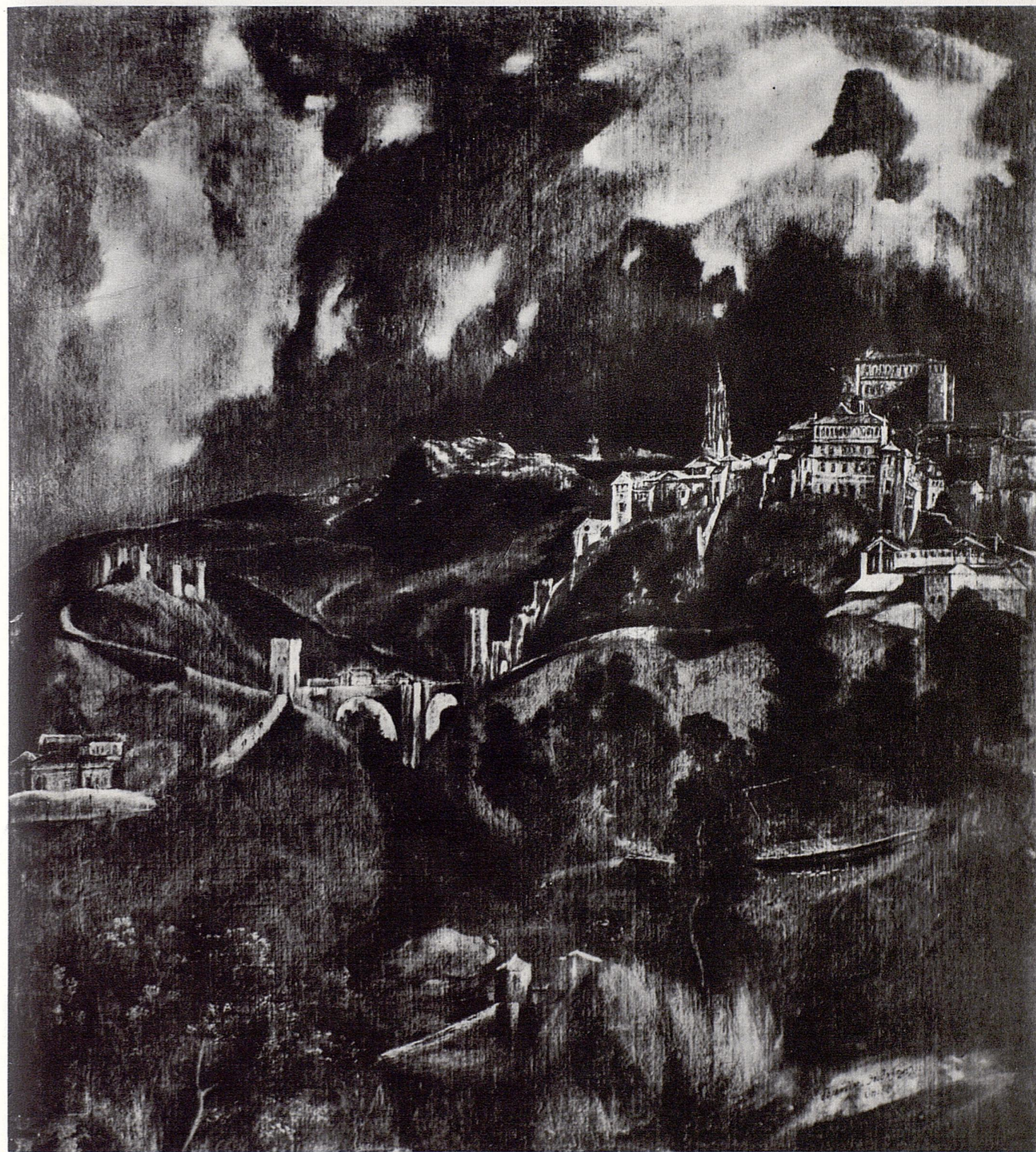
LE GRECO. TOLÈDE SOUS L'ORAGE.