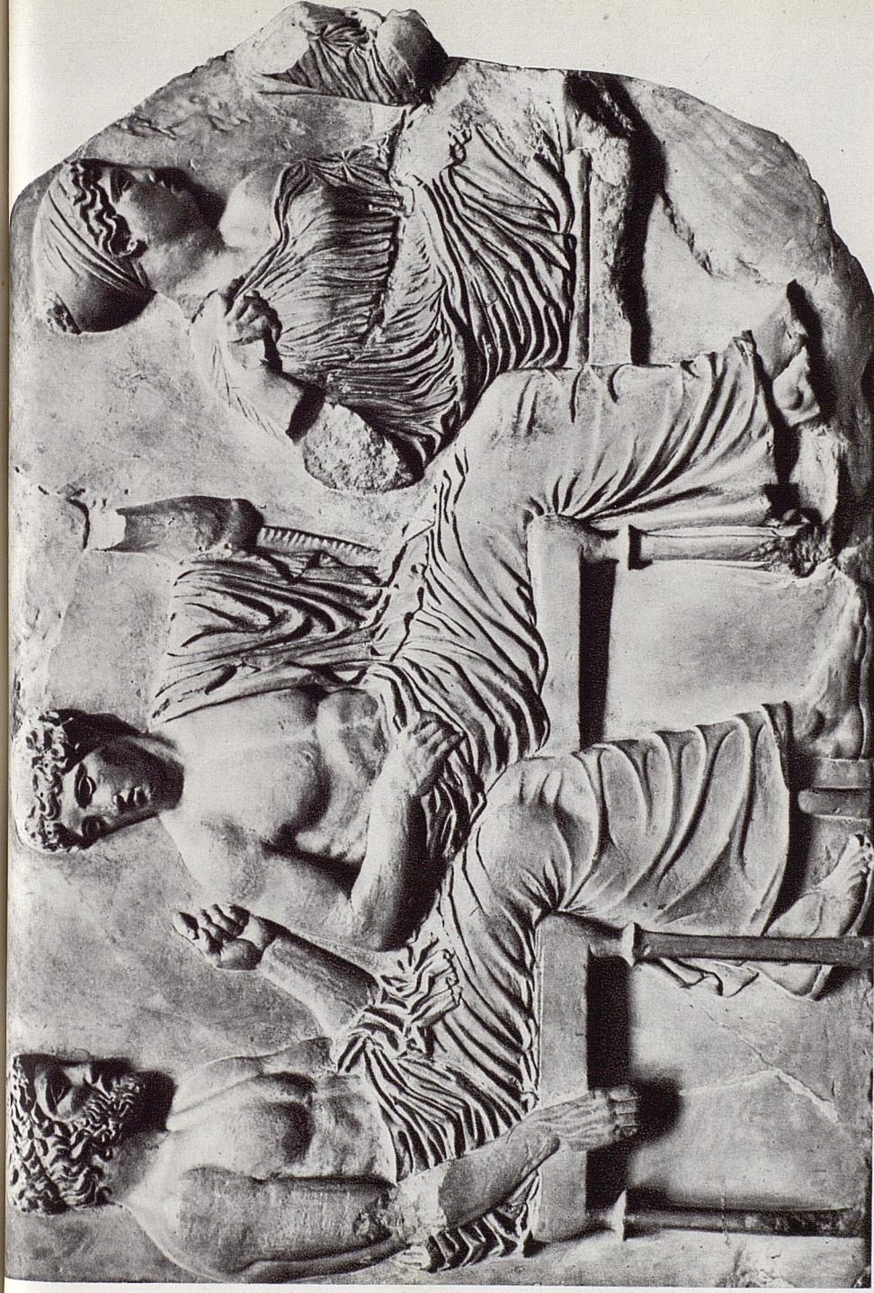
81. POSEIDON, APOLLON, ARTÉMIS. FRISE EST DU PARTHÉNON. MUSÉE DE L'ACROPOLE.