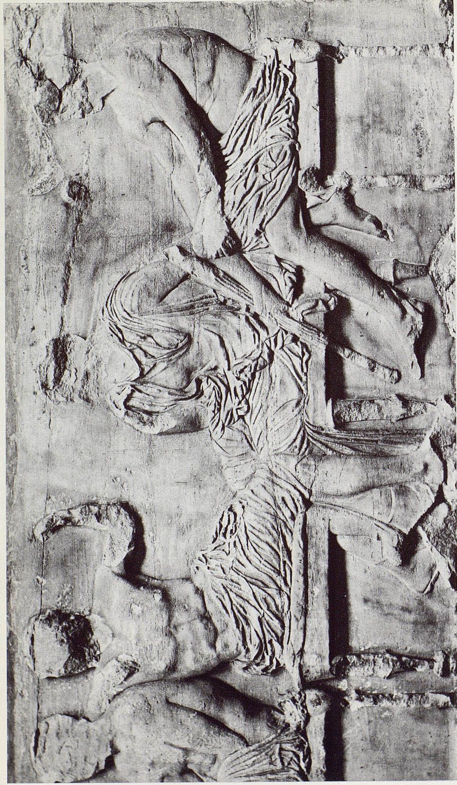
80. HERMÈS, DIONYSOS, DÉMÈTER, ARÈS. FRISE EST DU PARTHÉNON. BRITISH MUSEUM.