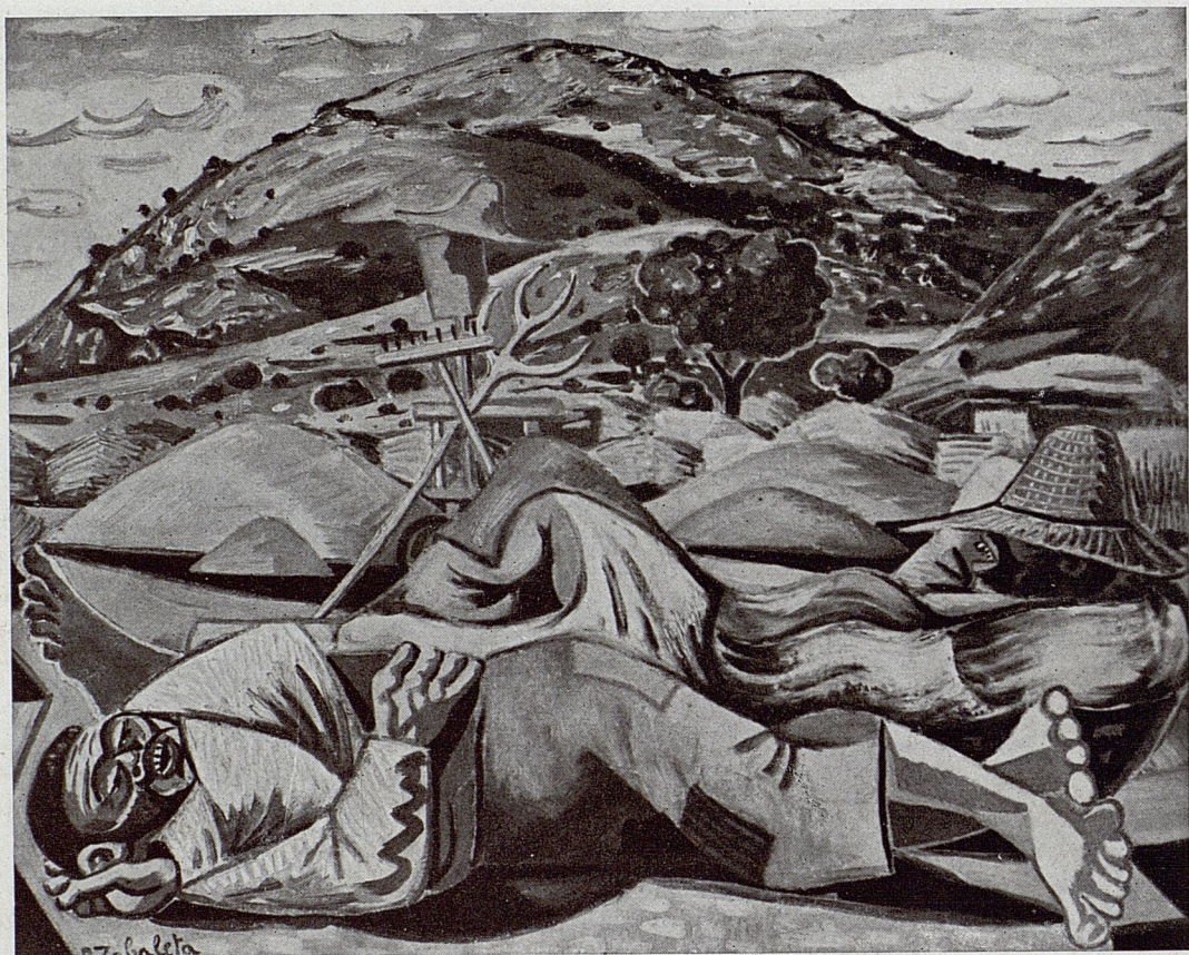
47. RAFAEL ZABALETA. La siesta