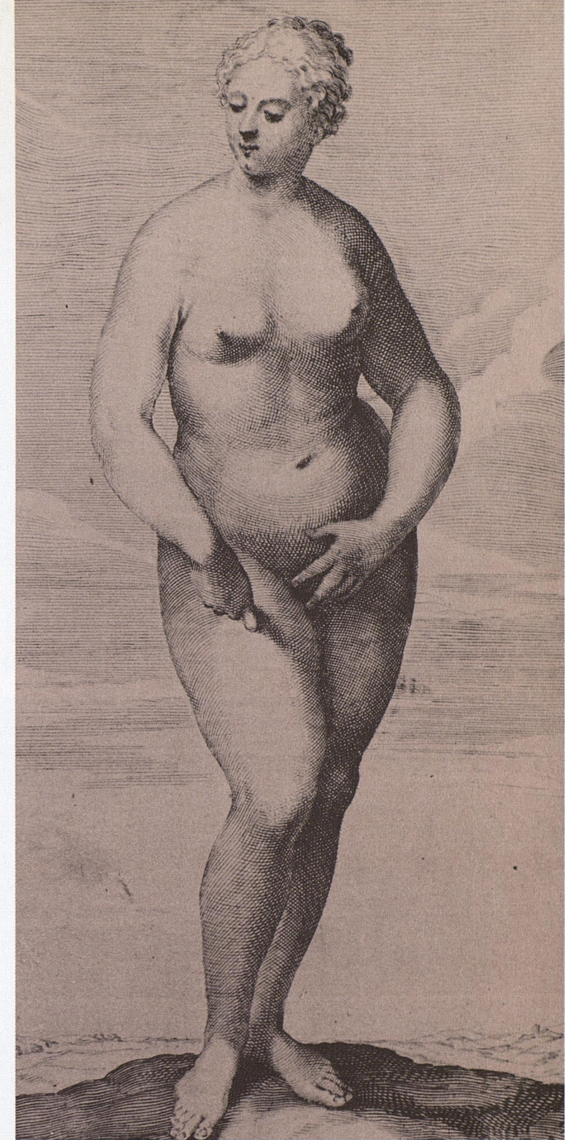
Fig. 618* ◇ . Jacopo PICCINI. Femme nue gravée d'après l'une des figurations peintes sur la façade du Fondaco dei Tedeschi , à Venise, par TITIEN alors âgé d'une vingtaine d'années, fresque aujourd'hui disparue. Burin.

La figure féminine gravée par Piccini (fig. 618) nous donne une idée de ce que le public, sans