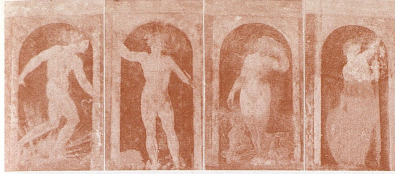
Fig. 614*, 615*, 616* et 617* ci-dessus. Quatre des divinités nues peintes à l'extérieur: Apollon, Mercure, Vénus et Minerve. Ornementation de la cour supérieure du château Saint-Ange à Rome, la forteresse des papes, où l'on voit encore la trace de personnages nus peints, grandeur naturelle, au-dessus de chaque porte, d'après les estampes de la suite des Divinités de la Fable gravées par Jacopo CARAGLIO et d'autres copistes, selon les compositions de Rosso.

à fresque sur la façade de la Casa Gussoni , sur le Grand Canal à Venise, des Allégories nues, connues par des gravures de Zanetti, et des personnages nus tels qu'Adam et Eve. On sait aussi qu'il peignit sur la façade de la Casa Mercello à San Trovaso des scènes d' Amours des Dieux . Véronèse peignit des scènes à sujets mythologiques sur la façade du Palazzo Erizzo et du Palazzo Nani à Venise. Vasari nous apprend que Giorgione peignit toute la façade de la Ca' Soranzo , également à Venise. Du même peintre, on a gardé le souvenir des fresques de la façade de la Casa Grimani où figuraient... quelques femmes nues de belle forme et d'un beau coloris, de la façade d'un immeuble sis place Santo Stefano et d'un autre sis sur le canal à Santa Maria Zobenigo, à Venise. Et la maison présumée de Giorgione offrait évidemment une façade peinte à fresque. On connaît, grâce à l'estampe d'Augustin de Venise (fig. 613), la belle composition de Raphaël, Vénus et Vulcain , qui était destinée, croit-on, à être exécutée à fresque sur la façade de la maison de Gio Battiferri sise dans le quartier du Vatican. Dans la cour du château Saint-Ange, à Rome, on voit encore sur les murs la trace de personnages nus tirés de la suite gravée des Divinités de la Fable de Rosso (fig. 614 à 617). Les gravures de Zanetti et Piccini nous restituent quelques-uns des personnages nus qui figuraient sur les fresques des façades du Fondaco dei Tedeschi à Venise, peintes par Giorgione et le jeune Titien.