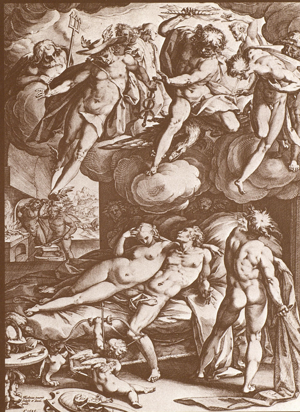
Fig. 1* ci-dessus. Henri Goltzius. «Mars et Vénus surpris par Vulcain». Burin de 1585.