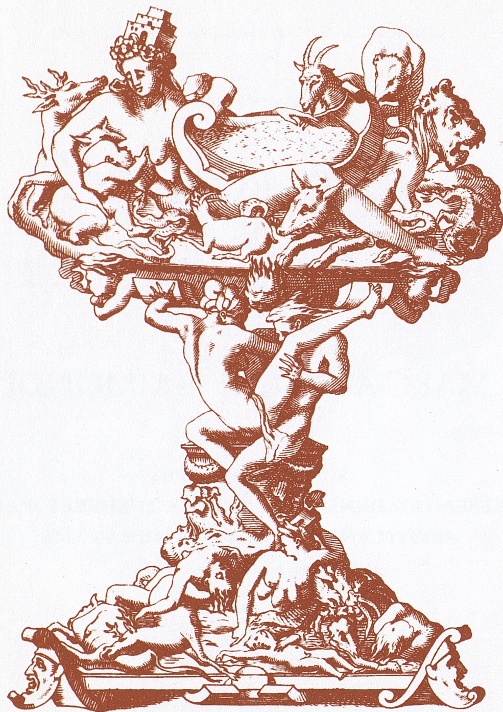
Fig. 7*. René BOYVIN. Modèle d'orfèvrerie pour une salière dont le nœud est constitué par la figuration des amours d'un dieu et d'une déesse. Burin.

(Paris, Bibliothèque de l'École nationale des Beaux-Arts).