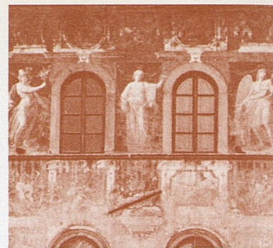
Fig. 612* ci-dessus. De nos jours, on voit encore, ici et là en Italie, des maisons du XVI e siècle dont la façade porte des vestiges de peintures ornementatives à fresque représentant des personnages ou des sujets profanes ou religieux.