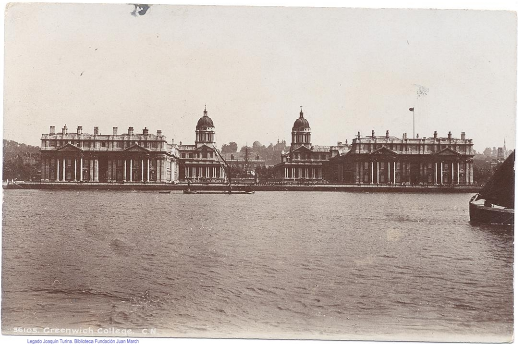
36105. Greenwich College. C.N.