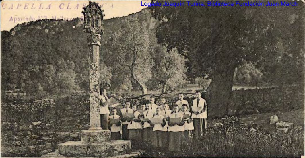
SANTUARI DE LA MARE DE DEU DE LLUCH