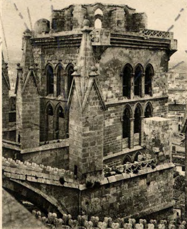
MALLORCA. Serie III — 5 - Catedral. - Campanario

Handwritten musical notation on a staff, including a treble clef and several notes.