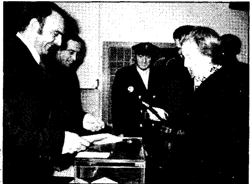
La esposa del Caudillo acudió a votar en el Colegio Municipal de El Pardo