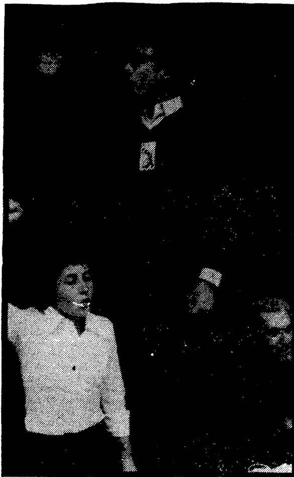
en el restaurante donde festejaron su boda. Junto a ellos, Camacho.