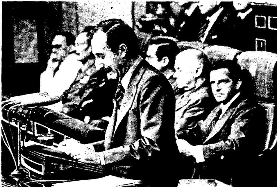
El señor Escrivá de Romani, defiende en el Pleno de las Cortes, el proyecto de la Comisión de Justicia sobre modificación de algunos artículos del Código Penal.