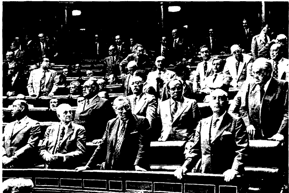
Los procuradores puestos en pie en el momento de la votación.

Esta vez no hará falta recordar Paracuellos ni entrar en dialéctica: La ley está tan clara que, ni deseando lo contrario se podría abogar en favor de la inscripción. Aunque, como dicen los abogados, sometemos nuestro parecer a otro que pudiera ser más fundado.