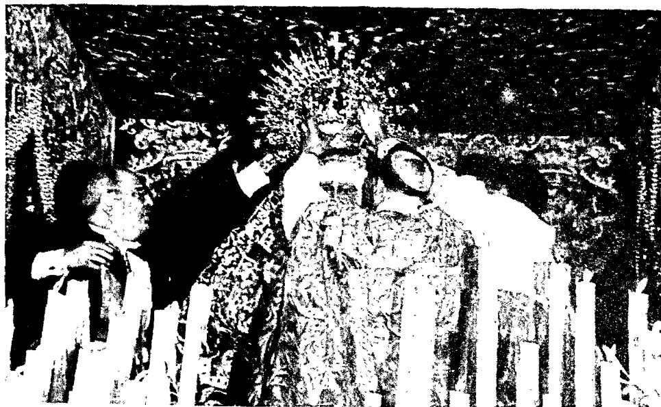
CORONACION CANONICA DE LA MACARENA. —Presidida por el Jefe del Estado y su esposa, se celebró en la Catedral de Sevilla la coronación canónica de la Santísima Virgen de la Esperanza, Macarena, acto que constituyó una impresionante manifestación de fe.