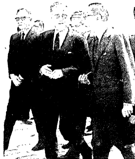
AHMED BALAFREJ , ministro del Gobierno marroquí, representante de S. M. el Rey Hassan II, que también se encuentra en Madrid.