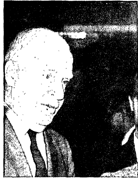
LUTHER HODGEN , secretario norteamericano de Comercio, a su llegada a la base conjunta de Torrejón en visita oficial a España.