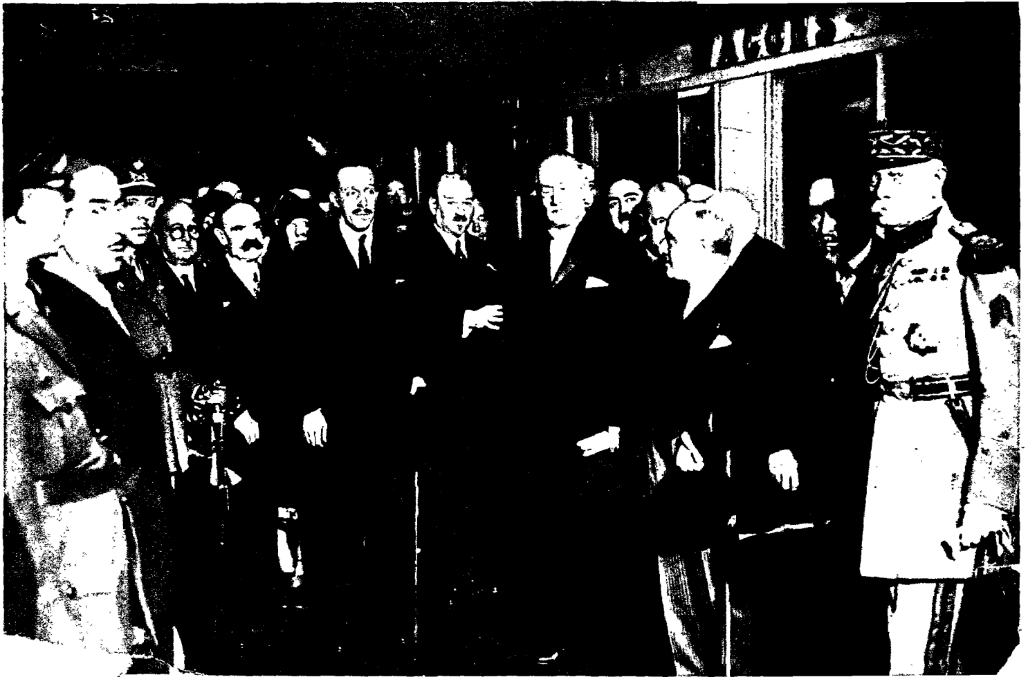
Rey Don Alfonso XIII, a su izquierda. Era el 16 de abril de 1931.

...siva (extraña profecía la del hombre que se pasó la existencia predicando a sus compatriotas, de una manera o de otra, las delicias de una guerra civil; el ángel del patriotismo refina en el seno de su conciencia contra el demonio de la egolatría. París, adonde llegó desde la Isla de Fuerteventura, se le hizo insufrible, y él a París, por lo que se vino a Hendaya para reconocerse a sí mismo, necesitando, como Santo Tomás, de las llagas de Cristo, en realidad, por lo menos ocular, que nutriera su sensibilidad indigenista. Con ayes y resuellos de nostalgia, vertidos en versos y prosas de penetrante lirismo, y con insultos de panfleto más chabacanos (¡naturalmente, naturalmente!) que ingeniosos, impresos en sus clandestinas Hojas Libres, entretuvo su voluntario extrañamiento.