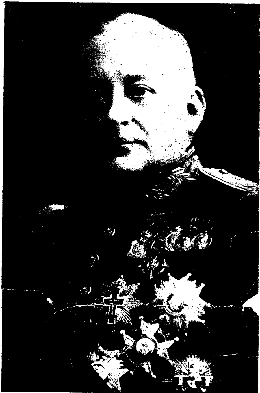
General D. Miguel Primo de Rivera.

U N elemento de juicio que no se debe olvidar o que es conveniente retener cuando del general Primo de Rivera se trate, y el tema asoma al reloj de cuco de la actualidad, porque mañana se cumplen treinta y cuatro años de la muerte del gran gobernante, es su propia certidumbre en que, caído él del Poder, iba su Patria a la deriva hacia mares de naufragio, porque estaba seguro de que cuanto había tejido o zurcido o remendado se rasgaría o descosería en seguida. ¿Es lo que suele acontecer cuando jefes, hombres públicos o sencillamente responsables de algo o de alguien, arregostados a ejercer autoridad, jefatura o administración, se sienten precipitados de la facultad de mando a la impotencia del ostracismo? Superficialmente, sí; pero en semejantes situaciones no es difícil amojonar lo falaz y lo verdadero, distinguiendo a los Isaías clarividentes de las falsas Casandras, al profeta del hechicero.