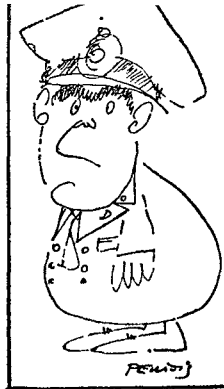
Pinheiro de Azevedo: sigue el sexto Gobierno