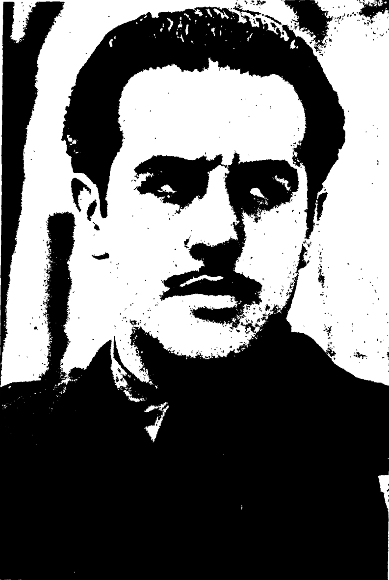
Girón, en su discurso de Valladolid, definió al «centro» como la «tendencia moderada»

tres personas que aparecen más abajo no se citan como cabezas de nada, sino simplemente como definidoras del tema, con variantes, como queda dicho. Veamos: