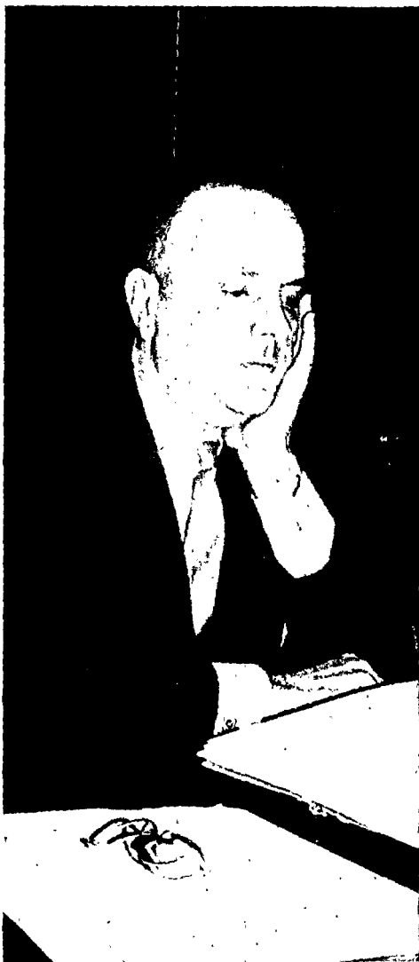
Fraga opina que el «centro» es: reformista, prudente, antidogmático, liberal (no libertario), evolutivo...

del sistema y a la izquierda al socialismo democrático».