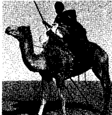
Mito y realidad: los hombres azules.