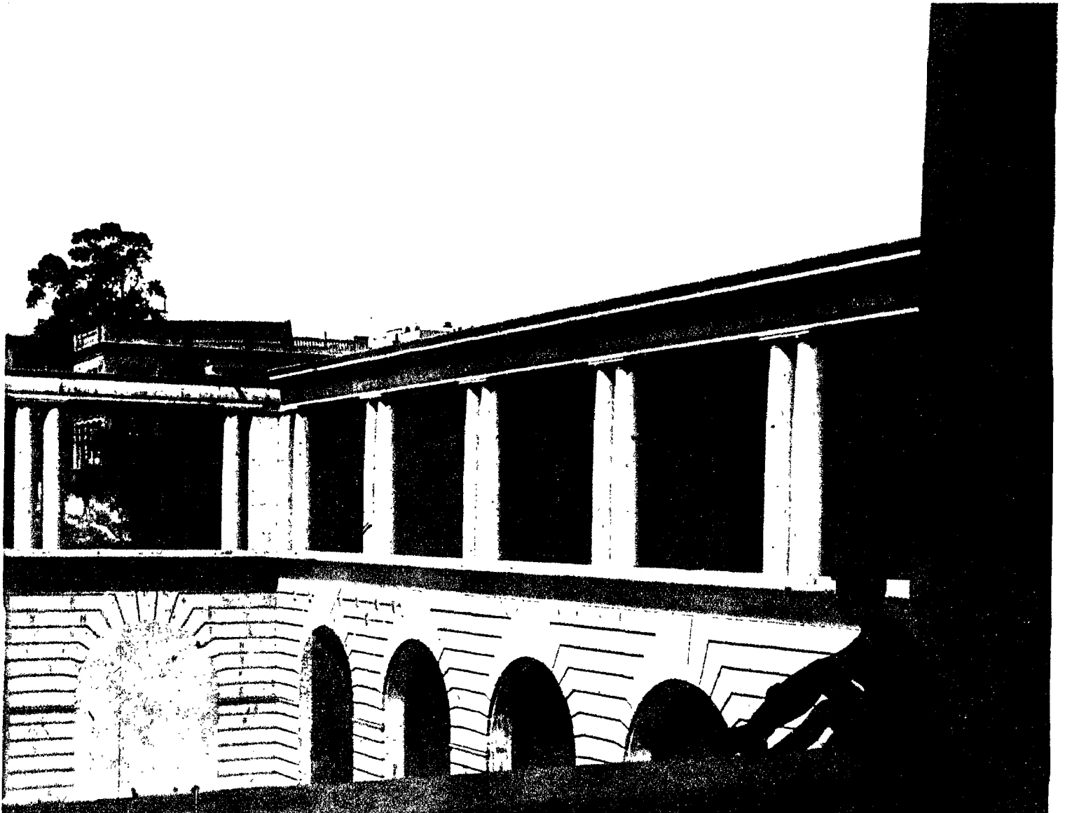
Vista del espacio ajardinado de la "Casa de las Flores", conjunto residencial de clase media, comenzado en 1930 y terminado en 1933, obra del arquitecto Secundino de Zuazo.

Párrafo aparte merece lo del "respeto a la esencia popular", porque aquí no bastan las declaraciones de principio: hay que descender a definir lo popular esencial. Y por muchos esfuerzos que se hagan resulta difícil encontrarlo en muchos de los proyectos que se publican en el número citado de "L'Architecture d'aujourd'hui". Todo el mundo, salvo los revolucionarios, están