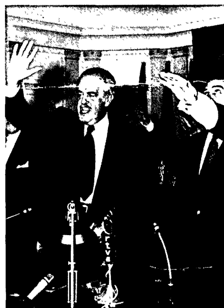
FUE UNA JORNADA DE HIMNOS: EL CARA AL SOL, EL ORIAMENDI, EL HIMNO DE LA LEGION Y EL DE LA INFANTERIA

Ahora Girón advierte que "van a pasar muchas cosas", mientras la Confederación anuncia, en su declaración de principios, que quiere "promover la movilización espiritual de todos los