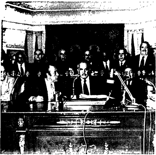
GIRON POCO ANTES DE SU DISCURSO

pitalismo o del comunismo, a que el pueblo haga una revolución cultural, a que se mantenga el espíritu religioso "frente al materialismo capitalista y marxista de la sociedad", que, en fin, "las tendencias políticas encuentren el cauce de su legítima expresión", exige, sobre todo, que no sea posible que alguien pueda sentirse avergonzado de sus heridas de combate y que el último fin del Régimen no sea aniquilar a sus leales.