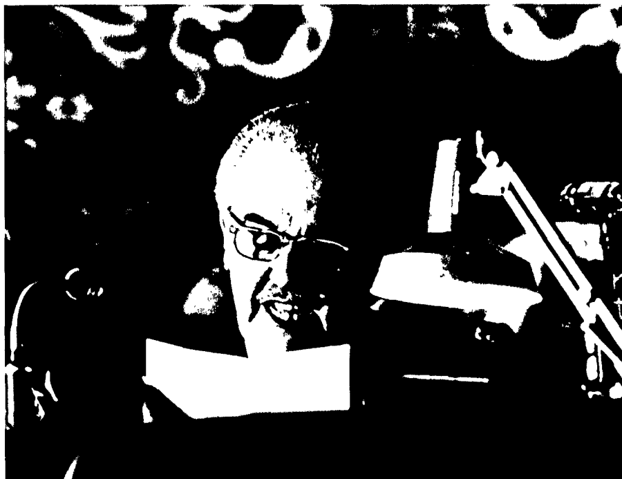
AQUI HAN PASADO MUCHAS COSAS Y VAN A PASAR MUCHAS MAS

Pero en dos años el país ha cambiado mucho ("El pueblo español se ha pronunciado —decía entonces "ABC", comentando el discurso de Girón en Valladolid— a favor de la instauración de la Monarquía como forma de gobierno"), Franco ha pasado por el momento más grave de su