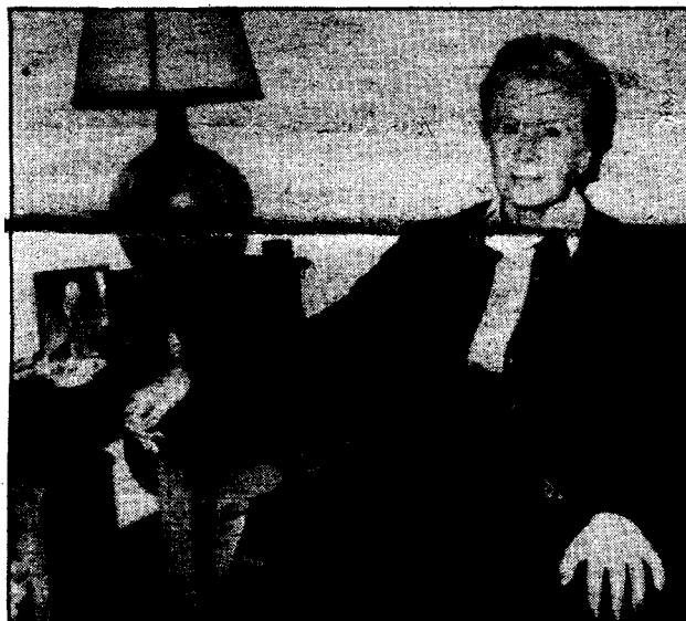
La señora de Rupérez, en el domicilio de su hijo secuestrado.

Al parecer los detenidos no parecen tener vinculación con el secuestro aunque sí con las actividades de ETA.