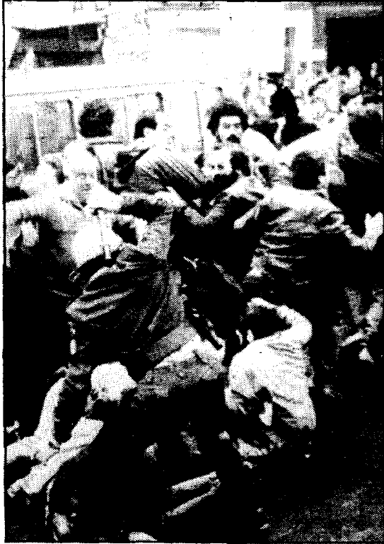
Gritos en favor de la organización terrorista ETA, colocación de barricadas y enfrentamientos con la Policía se registraron en la manifestación «pacifista»

● Extraordinarias medidas de seguridad en el juicio iniciado en la Sala del Tribunal Supremo contra los diecinueve procesados de Herri Batasuna acusados de injurias al Rey en la Casa de Juntas de Guernica el 4 de febrero de 1981. El fiscal solicita penas de más de ocho años de prisión y 11 años a uno de ellos, acusado de colaboración con marxistas te-