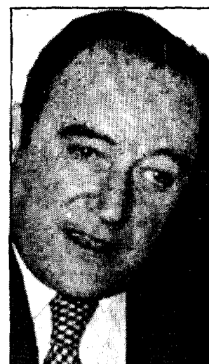
El jefe del Gobierno francés, Pierre Mauroy, y su ministro de Justicia, Maurice Faure, tendrán que decidirse en las próximas horas sobre la extradición del etarra Linaza.

ETA militar, acusados de delitos semejantes. En principio, si no hay retrasos de última hora, los procesos de esas demandas deberán verse en las Cortes de Justicia de Pau (Pirineos Atlánticos) y Aix-en-Provence, antes del próximo día 15 de este mismo mes (un día antes de la primera vuelta de las inmediatas elecciones legislativas).