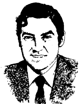
P. J. R.

Es difícil ponerse en su lugar, pero el Gobierno González tiene que hacer un monumental esfuerzo de comprensión hacia las dificultades, debilidades y tentaciones del Gobierno Garaicoechea. El presidente debe dedicar una parte mucho mayor de su tiempo y atención al seguimiento del que continúa siendo principal problema del nuevo Estado. Menos ocuparse de Centroamérica y más del País Vasco: Managua está en Rentería y donde hay que construir la «vía Contadora» es en el palacio de la Moncloa. Y si nueve horas no son suficientes, habrá que reunirse otras nueve, otras nueve y otras nueve. Y si la única manera de conseguir que el señor Guerra no salpique de frivolidad y de esperpento un proceso tan crucial para la suerte de España es dejándole fuera, pues habrá que limitar las reuniones a aquellas personas que sepan comportarse de manera digna y decente, que por fortuna no escasean en el Gobierno socialista. ¿Acaso no nos damos cuenta de que el «mal militar» volverá a reproducirse entre nosotros en cuestión de muy pocos meses, si las cosas en el País Vasco siguen por el camino que van?