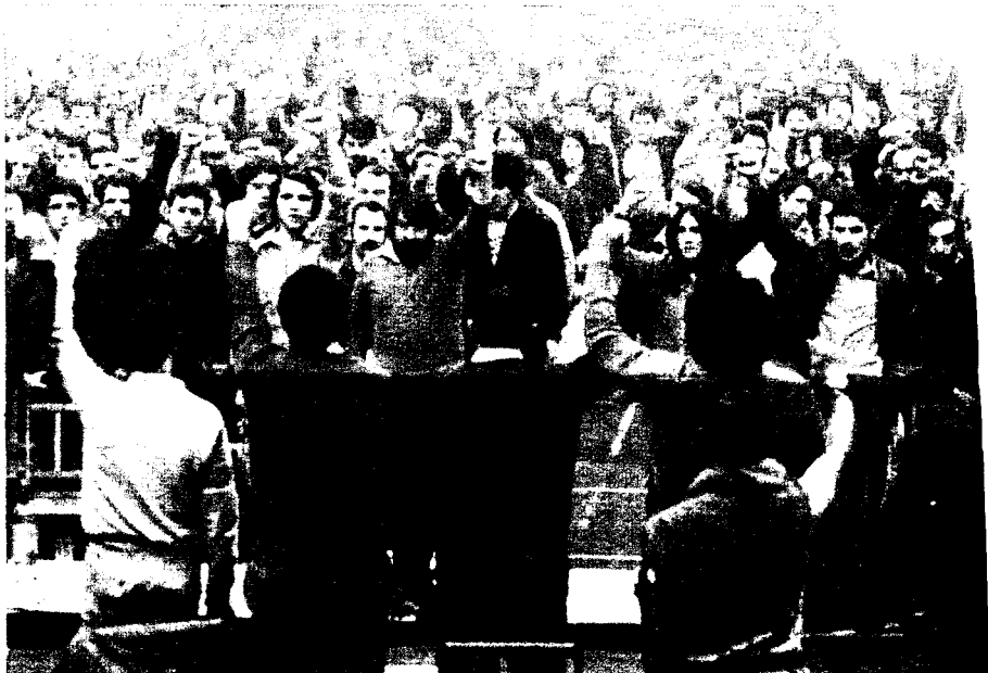
Los vascos hoy, y desde siempre, luchan por la autonomía.

Explica cómo en el proceso constituyente español fueron marginadas