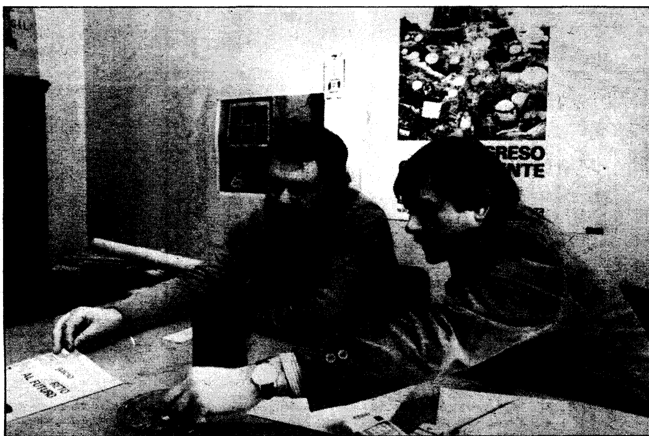
El congreso definirá un punto de partida, pero cada uno seguirá siendo lo que quiera, aunque con una sola línea política.

«Lo del PSUC es un drama. Nos gustaría que pu-