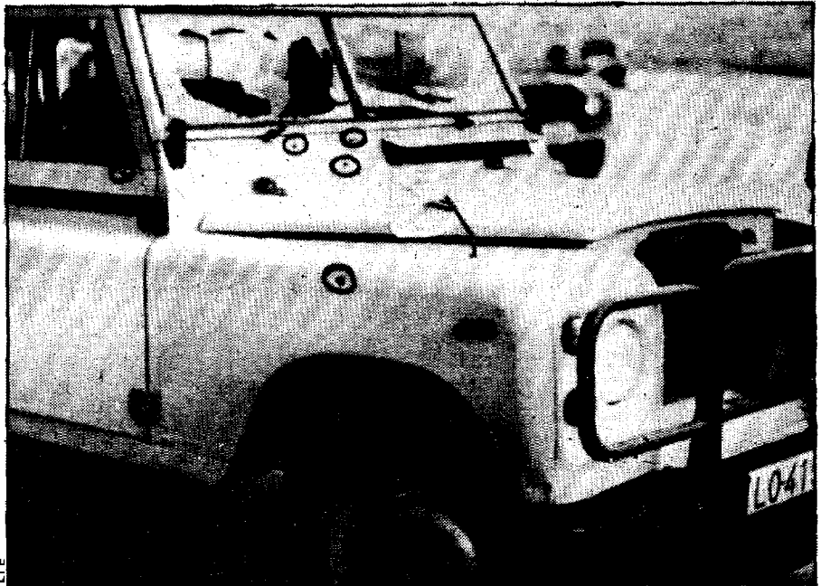
Así quedó el vehículo del teniente tiroteado.

los indicios hacen suponer que habría sido la misma organización la autora del mismo.