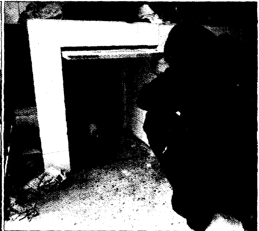
El caserío donde se ha encontrado el arsenal de armas y explosivos de ETApM. A la derecha, el agujero por donde se entra en el depósito de las armas, semejante al efectuado en la casa de Trasmoz donde estuvo secuestrado el doctor Iglesias.

El hallazgo es fruto de la detención de los secuestradores del padre de Julio Iglesias