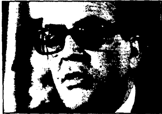
«Que el Gobierno se las arregle para infundir más confianza. Que sean ellos los que nos den ánimos.»

Que luego vemos cómo desde el poder se toman decisiones que no van dirigidas precisamente al reforzamiento de las libertades individuales o colectivas. Que luego nos encontramos con que desde el Gobierno y desde la oposición se recrean en conducir esto por tortuosos caminos nada