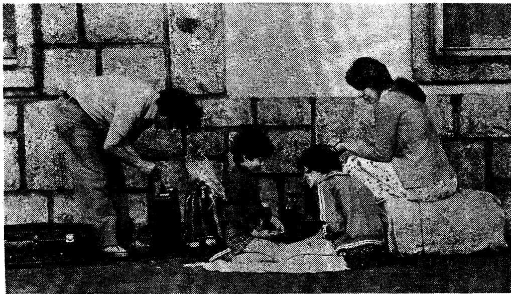
Maletas y plásticos con patatas fritas para los retoños.

Otros, con mayor fortuna y decisión, terminan navegando en cualquier barco de bandera panameña o liberiana, tras embargar sus enseres para pagar la comisión al "embarcador" de turno.