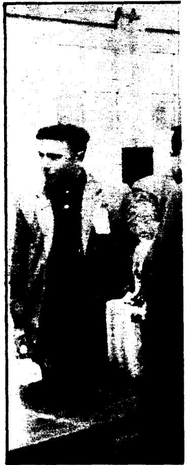
Los ingresos de divisas