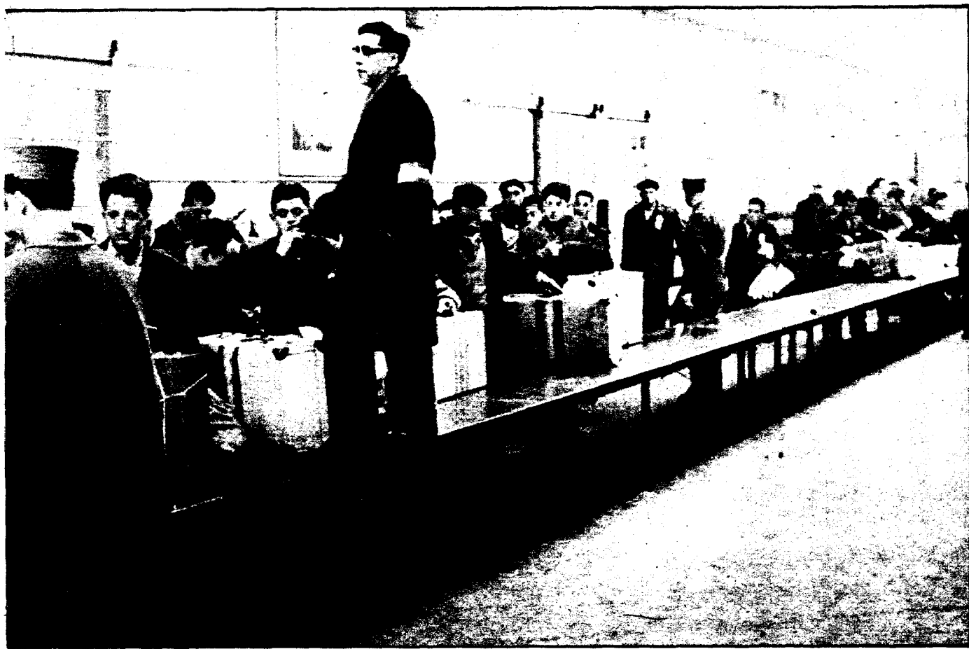
por remesas y transferencias de capital de emigrantes han disminuido notablemente en el último año