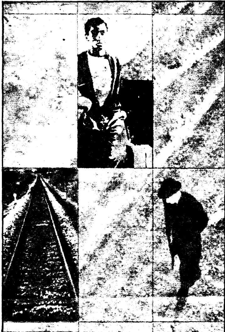
¡Cuántas veces el emigrante tiene que oír, aun con el cuchillo de la soledad, esa terrible frase: "Extranjero, lárgate!"

No se prevé un inminente retorno masivo, pero el miedo, la inseguridad y el paro crean una psicosis de repatriación