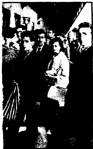
a Ginebra para trabajar campo