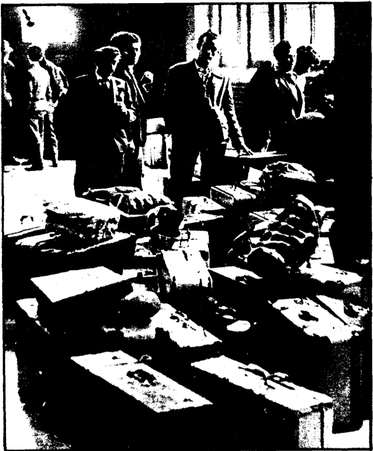
Un grupo de mineros españoles abandona Holanda

DOSCIENTOS CINCUENTA MIL NIÑOS ESPAÑOLES SE HALLAN REPARTIDOS POR EUROPA ● LOS EMIGRANTES HAN ESTADO APORTANDO A ESPAÑA UNOS MIL MILLONES DE DOLARES AL AÑO