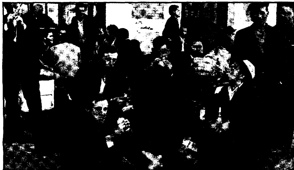
En esos países de emigración surge espontáneamente ese grupo en torno al bocadillo y la bombona de vino

No se prevé un inminente retorno masivo, pero el miedo, la inseguridad y el paro crean una psicosis de repatriación