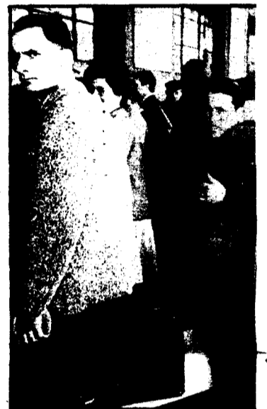
Emigrantes españoles llegan en el