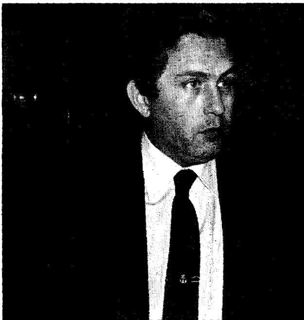
Jesús Sancho Rof, ministro de Trabajo, Sanidad y Seguridad Social.

Por otro lado, a propuesta del ministro de Trabajo, Sanidad y Seguridad Social, el salario mínimo interprofesional pasa de 759 pesetas diarias a 854, con carácter retroactivo al 1 de mayo. Preguntado García Díez