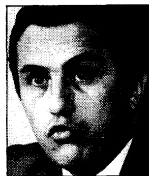
José María Cuevas, secretario general de CEDE; Juan Antonio García-Diez, ministro de Economía, Jesús Sancho Rof, ministro de Trabajo, siguen sin abordar los temas monetarios

conversaciones está siendo el tema salarial, en el que existen tres posturas. Por un lado, los sindicatos están dispuestos a aceptar para 1982 una subida salarial de dos puntos por debajo del índice de precios al consumo previsto para ese año, lo que supone una banda salarial del 9 al 11 por 100. El Gobierno, por su parte, defiende una subida del 8 al 11 por 100, con un IPC estimado del 12 por 100, y la