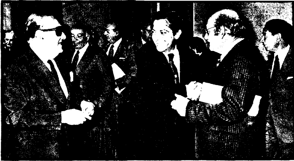
El entonces ministro secretario general del Movimiento resultó elegido consejero permanente, "de los 40 de Ayete", en el Pleno del Consejo Nacional. Adolfo Suárez obtuvo 66 votos; el marqués de Villaverde, 25. En la fotografía aparece saludando a los consejeros Domingo Solís e Iniesta Cano. En segundo plano puede verse a José Solís y al teniente general De Santiago.

detalles, grandes y pequeños, a la muerte del ministro. «El estaba en los toros con mi madre. Era la corrida de Beneficencia. Le dieron allí mismo la noticia. Hizo salir a mamá y... la fue preparando. Adolfo marchó inmediatamente a Villacastín donde había ocurrido el accidente. Ya te puedes imaginar cómo estaba él también: destrozado y sin coraje para nada; pero se sobrepuso y, entre lágrimas se ocupó de todo: la capilla ardiente, el traslado en avión de los restos... ¡Ah! recordó que mi padre quería ser enterrado con el escapulario de la Virgen del Carmen y envuelto en una sábana sencilla. Y se encargó también de eso... Te contaría y no acabaría nunca. No pudo hacer más, ni mejor.»