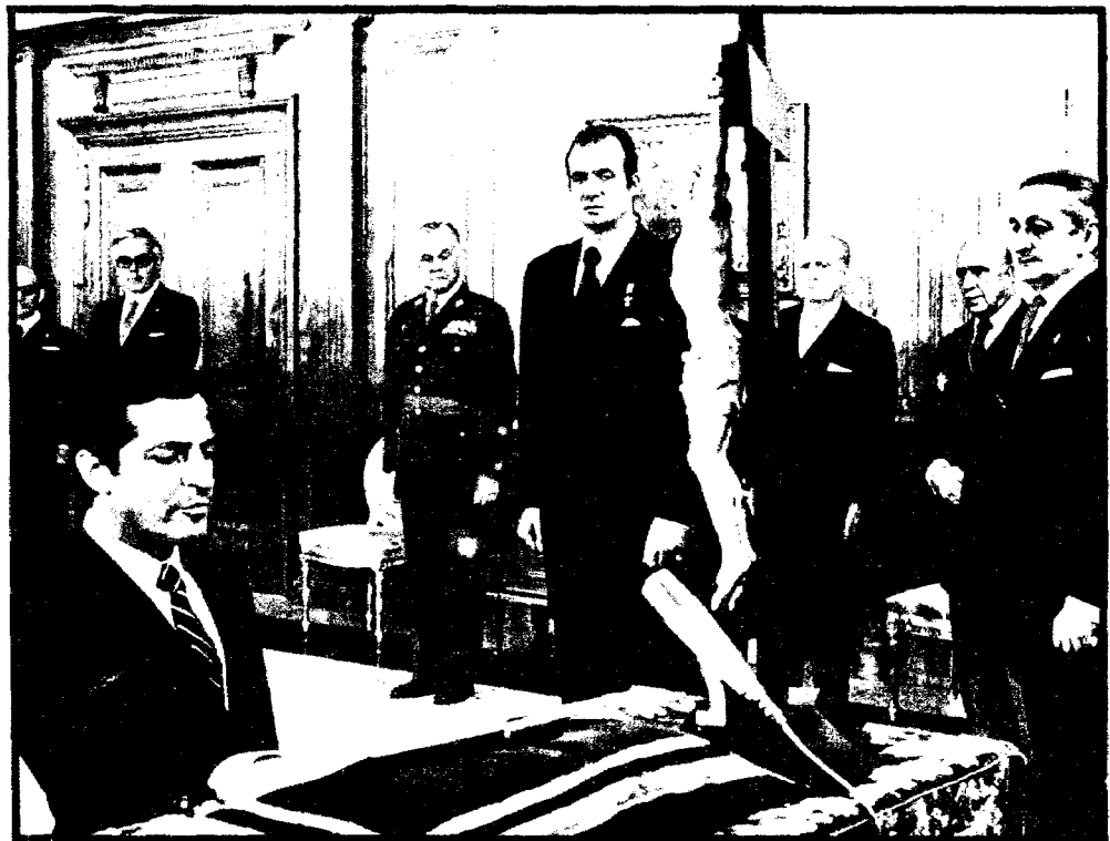
El Consejo del Reino presentó su "terna" al Rey y éste designó a Adolfo Suárez. Aquí le vemos jurando, de rodillas, "como antes", su cargo de presidente del Gobierno. Era la tarde del 5 de Julio del 76, en el Palacio de la Zarzuela.