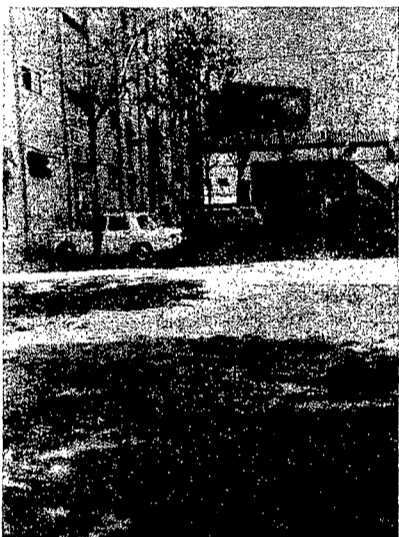
Barrio de San Fermín

El Ayuntamiento ha aceptado, del Ministerio de la Vivienda, más de cien hectáreas de viales y urbanizaciones repartidas en diversas barriadas. En total, se reciben 10.230 viviendas con una población de 40.920 habitantes. Las barriadas, en concreto, son: Poblado Dirigido de San Cristóbal de los Angeles, Poblado San Fermín, de Villaverde, Poblado Dirigido de Almendrales, Poblado de Canillas, Gran San Blas, tercera fase, Colonia Cruz del Rayo, Colonia de la Vivienda Barata, Colonia Primo de Rivera, Poblado de Absorción de la Ventilla y Poblado Dirigido de Nuestra Señora de Begoña.