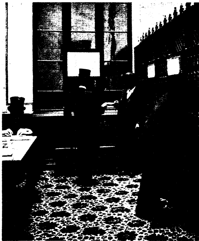
AQUELLOS TIEMPOS...—A finales del siglo pasado, los congresistas tenían la obligación de vestir levita y llevar chistera. En la foto, La Estafeta del Congreso en 1898.

Como afirma el historiador don Carlos Iglesias Selgas, que se ha ocupado profunda y documentadamente sobre el «pasado, presente y futuro» de las Cortes, aunque éstas tuvieron su primera manifestación en Cádiz, como órgano de representación nacional unitaria, no puede desconocerse su configuración en la Constitución definitivamente hecha por el emperador Napoleón en Bayona, aceptada en julio de 1808.