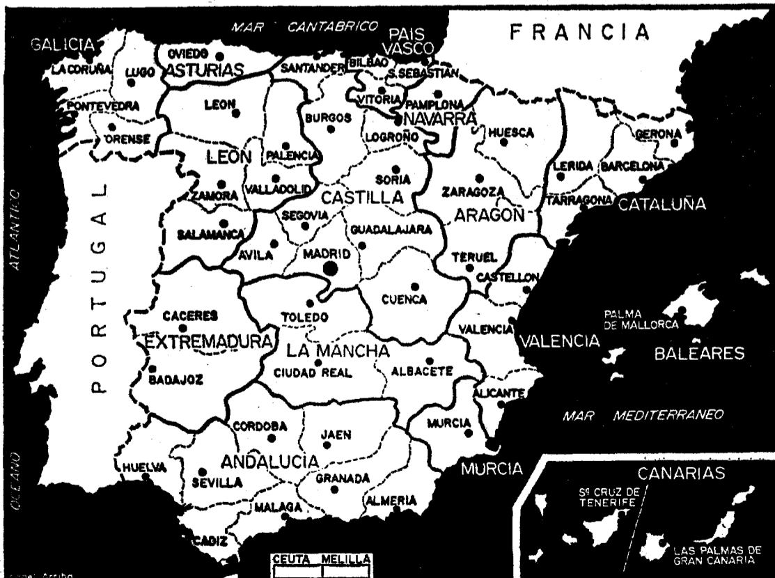
España es un conjunto de naciones, cada una peculiar, cada una diferente.