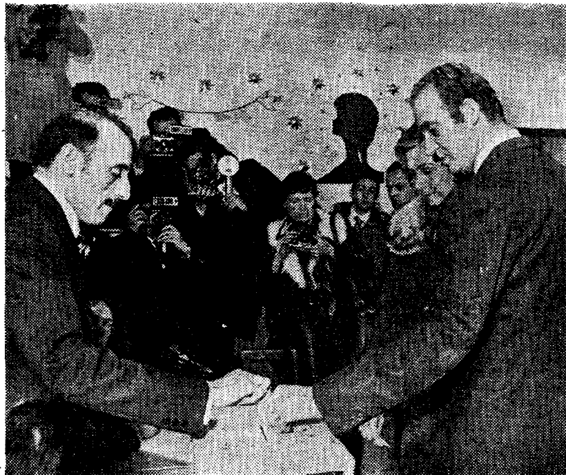
El Rey introduce la papeleta —que llevaba en el bolsillo— en la urna del Pardo

SE está celebrando en toda España el referéndum sobre la reforma que permite al pueblo decidir el destino político del país. Desde las nueve de la mañana, la afluencia de votantes a los colegios electorales de todo el país ha sido, según los primeros datos, muy amplia, y se produce dentro de una calma generalizada.