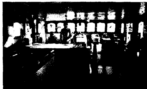
Los puentes de mando de nuestros buques pesqueros precisan de especialistas y técnicos en electrónica, frío, navegación, sonares, etcétera. Puente del "Gondomar".