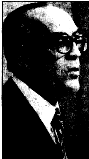
La oposición, e incluso UCD, quieren que Calvo-Sotelo y Rosón expliquen el alcance del suceso de Barcelona.

Siguen creyendo que el asalto al Banco Central forma parte de la trama golpista, pero sobre los ejecutores de la acción no tienen más información que la que se ha facilitado.